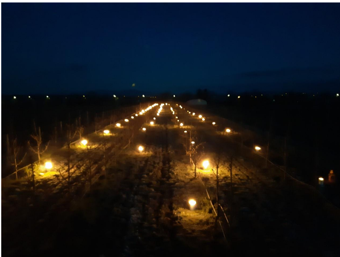
Slika 4 -Stop gel svijeće u nasadu trešanja