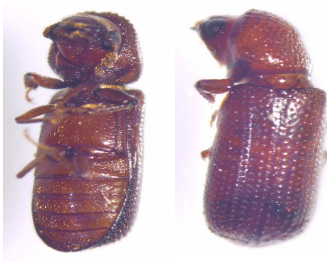
Slika 6. Rhyzopertha dominica Fabricius – Žitni kukuljičar

temperature, već i biokemijski na sastav zrna. Zbog svoje potrebe za visokim temperaturama R. dominica tipičan je štetnik silosno – skladišnih objekata. Osim pšenice tj. žitarica, napada suho voće i prerađevine, sjemensku robu. Ženka odlaže 300-500 jaja, te najkraći razvoj u optimalnim uvjetima traje 24 dana. Ima 2 generacije.