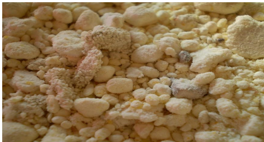
Slika 3. Prisutnost filtova i produkata u prerađevinama – brašno

U skladu s važećim propisima Pravilnika o žitaricama, mlinskim i pekarskim proizvodima, tjestenini, tijestu i proizvodima od tijesta (NN 78/05, 135/09, 86/10, 72/11) propisuje da se u