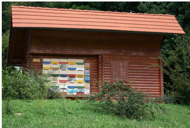
Slika 7: Stacionirani paviljonski pčelinjak

Stacionarni paviljonski pčelinjaci (Slika 7). Košnice iz ovih paviljona se u pravilu ne sele. U zadnjem dijelu paviljona najčešće je prostorija iz koje se vrši pregled košnica. Ova prostorija se koristi i za vrcanje meda, kao manje skladište i za slične potrebe. U nekim krajevima, a naročito u Sloveniji, postoji običaj da se prednja strana paviljona oslikava pčelarskim motivima. Tako pčelarski paviljoni postaju i male umjetničke galerije. U današnje vrijeme pčelinjaci ovog tipa koriste se i u zdravstvene svrhe primjenjujući apiterapiju i dajući pčelinjaku jedno potpuno novo značenje.