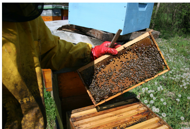
Slika 16 : Pojačavanje leglom

Pojačavanje pčelinjih zajednica pred glavnu pašu provodi se s ciljem maksimalnog iskorištavanja nadolazeće paše, tj. postizanja što većeg prinosa meda po košnici, a što postižemo povećanjem broja pčela u zajednici. Samo pojačavanje radimo dodavanjem okvira s poklopljenim leglom, prema vlastitoj procjeni (Slika 16). Okvire s leglom dodajemo najmanje petnaest dana prije početka glavne paše iz razloga da se dodano leglo izlegne i oslobodi prostor za smještaj nektara. Kod AŽ košnica pojačavanje vršimo leglom iz pomoćnih zajednica (Slika 17), dok kod LR košnica pojačavanje vršimo spajanjem nedovoljno jakih zajednica koje nisu u stanju donijeti značajne količine meda.