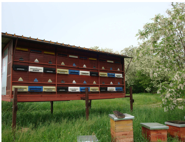
Slika 8: Kontejner