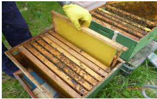
Slika 11 : Proširivanje plodišnog prostora

ulica u plodištu koji popunjavaju pčele s krajnjih ulica gdje nema legla (Slika 11). Pošto je period naglog buđenja prirode i pčela, matica će vrlo brzo zaleći dodani prazni okvir. Kod slabijih društava novi okvir dodajemo između krajnjeg okvira s leglom i okvira s cvjetnim prahom na strani kako se ne bi razbila cjelina gnijezda što može imati suprotan učinak od željenog.