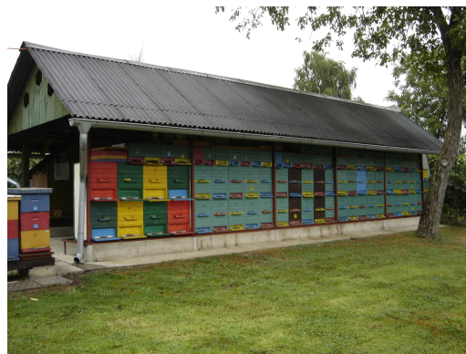
Slika 2: Stacionarni pčelinjak

U velikom broju slučajeva, kada je izbor mjesta za pčelinjak u pitanju, pčelari ne mogu baš mnogo birati. Međutim, uvijek kada je moguće treba pri izboru mjesta za pčelinjak birati terene koji su blizu pčelarevog prebivališta, zaštićene od jakih vjetrova, blago nagnute k jugoistoku i što bliže podnožju. Mjesto mora biti ocjedito i udaljeno od prometnica, kao i od visokonaponskih električnih vodova i jačih trafostanica. Bitno je isključiti mogućnost da pčele budućeg pčelinjaka ometaju susjede, kao i ljude i domaće životinje koji koriste uobičajene prolaze i poljoprivrednike na imanju. (Laktić, Z. 2008.) Potrebno je pridržavati se uputa propisanih u Pravilniku o držanju pčela i katastru pčelinje paše. («Narodne novine» br. 18/08., 29/13., 42/13., 65/14).