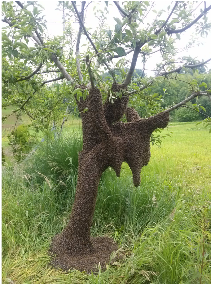
Slika 1. Zajednica pčela u prirodi

Pčele žive u velikim zajednicama od po nekoliko tisuća jedinki (Slika 1) . Pčela ne može živjeti sama za sebe i odijeljena od svoje zajednice brzo ugiba. Pčelinja zajednica sastoji se od ženskih i muških članova, ženski članovi su matica i radilice, a muški su trutovi. Matica je spolno razvijena ženka , a u svakoj zajednici nalazi se samo po jedna i živi u prosjeku 3 do 4 godine (Belčić i sur., 1990).