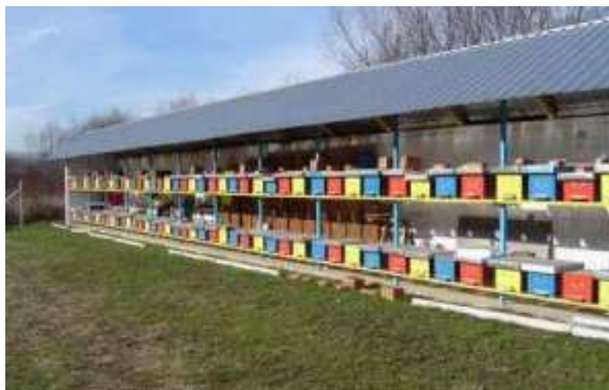
Slika 5: Pokriveni pčelinjak