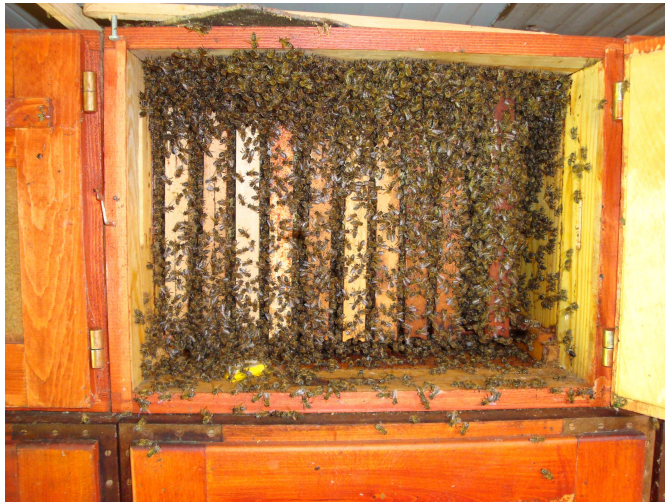
Slika 17 : Pomoćna zajednica