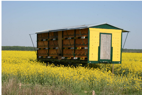
Slika 3: Seleći pčelinjak