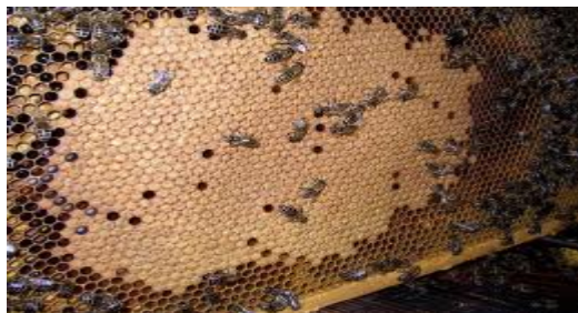
Slika 12 : Okvir s leglom

U ovo vrijeme počinje voćna paša, koja intenzivira razvoj zajednica. Ako je vrijeme dobro pčele će unijeti obilje nektara u košnice i početak će lučenje voska, tj. gradnja saća. Nektar koji pčele unose u košnicu može blokirati maticu u nesenju, zato je važno pravovremeno proširivanje zajednica i zapošljavanje mladih pčela u gradnji saća. Izgradnja saća je najbolji pokazatelj da je dnevni unos veći od dnevne potrošnje. Dakle u vrijeme cvatnje šljive, jabuke, itd. proširujemo plodišni prostor. Jačim zajednicama koje imaju najmanje pet okvira legla i deset ulica pčela dodajemo istovremeno po dva i više okvira satne osnove. Ove okvire stavljamo u sredinu, lijevo i desno od centralnog okvira s leglom. Slabijim zajednicama dodajemo po jednu satnu osnovu do legla (Slika 12). Novo dodane satne osnove pčele će u voćnoj paši brzo i kvalitetno izgraditi i matica će ih rado zaleći.