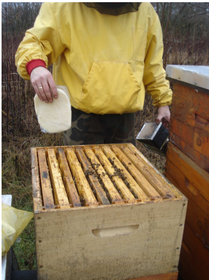
Slika 14 : Slaba zajednica

Pčelari znaju reći, zajednice imaju više bolesti, dok pčelarstvo samo jednu – slabe zajednice. U današnjim uvjetima življenja i pčelarenja važno je maksimalno iskoristiti sakupljački potencijal svake pčelinje zajednice i time osigurati rentabilno pčelarenje (Slika 14). Optimalan broj pčela u zajednici je između 40 i 55 tisuća pčela. Nije prihvatljiv pristup pčelarenju da će u dobrim godinama biti meda i da će pokriti sve gubitke u lošim godinama, potrebno je u svakoj godini u potpunosti iskoristiti pašu ovisno o uvjetima.