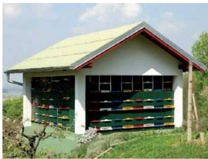
Slika 6: Paviljonski pčelinjak

Paviljonski pčelinjaci. U paviljonske pčelinjake smještaju se košnice koje se radi pregledanja i vađenja okvira otvaraju sa stražnje strane (AŽ košnice). Nekoliko košnica smještenih u dvije razine čine male paviljone (Slika 6).