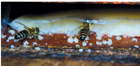
Slika 9: Prihrana pčela pogačom

košnici stvaraju uvjeti da matica intenzivnije polaže jaja. Šećerni sirup za prihranu pčela pripremamo u odnosu šećer: voda = 1:1. Za pripremu sirupa koristimo isključivo čist konzumni šećer.