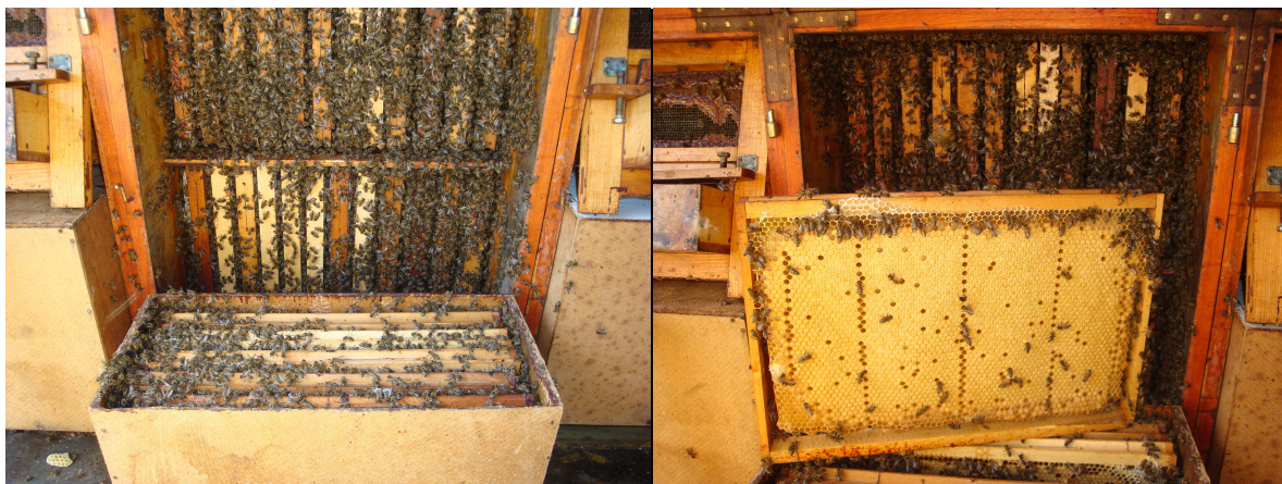
Slika 15 : Ograničavanje legla u kasetu pred bagremovu pašu.