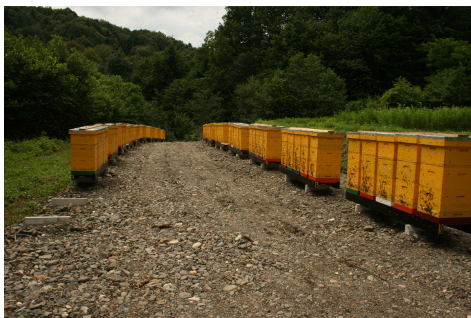
Slika 4: Otvoreni pčelinjak

Otvoreni pčelinjaci. Kod ove vrste pčelinjaka košnice su pojedinačno ili u grupama, postavljene na otvorenom prostoru (Slika 4.).