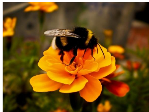
Slika 9. bumbar ( Bombus spp. ),