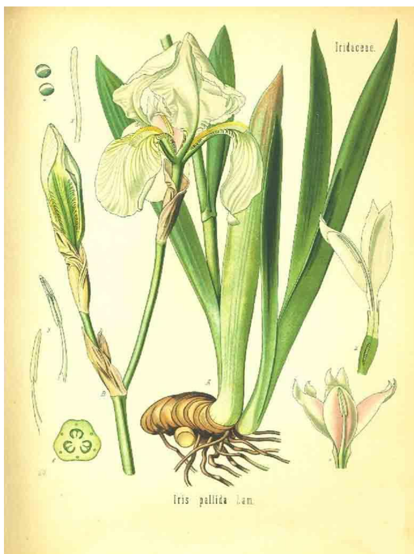
Slika 2. Blijeda perunika ( Iris pallida Lam.)

Od navedenih svojti patuljaste perunike su I. adriatica i I. pumila , koja kao i većina navedenih vrsta pripada „bradatim irisima“ (Pogon-Iris). Pripadnici grupe bez „brade“ (Apogon-Iris) su I. graminea , I. pseudoacorus i I. sibirica (Mitić i Cigić, 2009.).