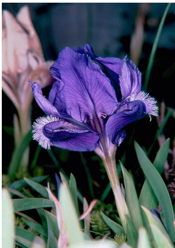
Slika 4. Iris adriatica (jadranska perunika)

Usko je endemična vrsta, rasprostranjena samo u Srednjoj Dalmaciji (u okolici gradova Zadar, Šibenik, Drniš i Unešić, te na otocima Čiovu, Braču, Viru i Kornatima). Raste na mediteranskom i submediteranskom tipu kamenjarskih pašnjaka. Njena staništa ugrožena su zbog zaraštavanja te je uvrštena u kategoriju NT (gotovo ugrožene biljke).