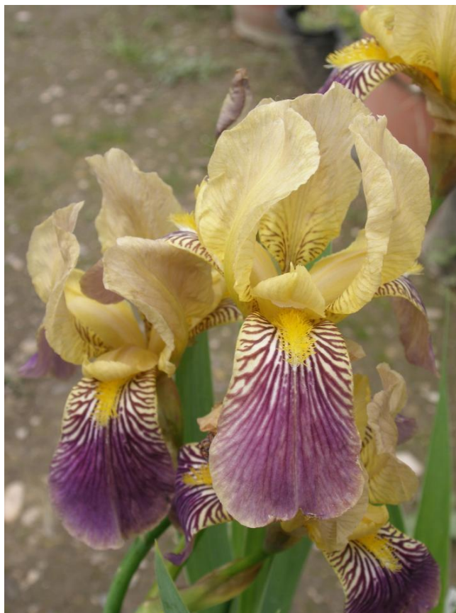
Slika 11. Iris rotschildii (Rotshildova perunika)

Rotshildova perunika je jedini prirodni samonikli križanac perunike u flori Hrvatske (Degen, 1936.). Roditeljske vrste su joj ilirska perunika ( Iris illyrica ) i šarena perunika ( Iris variegata ), što se vidi i po njenom izgledu u kojem su objedinjene značajke obaju roditelja. Ova perunika također ima podzemnu stabljiku (rizom), visinom je slična roditeljskim vrstama, uspravna stabljika visoka je do 40 cm, te nosi nekoliko šarenih cvjetova (boju su dobili od oba roditelja). Listovi su srpasto savijeni, široki 1-3 cm, nježni kao kod ilirske perunike, ali s izraženim žilama kao kod šarene perunike. Ovojni listovi (spate) su pri dnu zeleni kao kod šarene perunike, no pri vrhu suhi kao kod ilirske perunike. Vanjski listovi perigona su ljubičastožućkasti, a unutrašnji mutno žuti ili svijetlo ljubičaste boje. Čak i režnjevi tučka pokazuju značajke obaju roditelja, po sredini su žuti, a po rubovima ljubičasti. „Brada“ je uglavnom žuta. Prirodni križanac ilirske perunike ( Iris illyrica ) i šarene perunike ( Iris variegata ) raste na Srednjem Velebitu, na vrhovima iznad Karlobaga (Mitić i Cigić, 2009.).