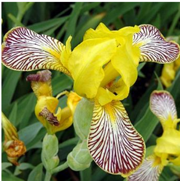
Slika 14. Iris variegata L. (šarena perunika)

Ova lijepa perunika u Hrvatskoj je zabilježena u brdskom području Gorskog Kotara i Velebita i Slavonije, a rasprostranjena je i na sličnim staništima diljem Europe (od Njemačke i Austrije do Rumunjske i Bugarske) (Mitić i Cigić, 2009.).