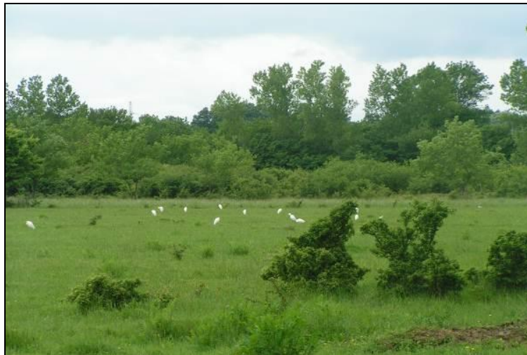
Slika 8: Pogled na centralni dio otoka Krka, «Omišljanski lug» - lovište VIII/101 Krk