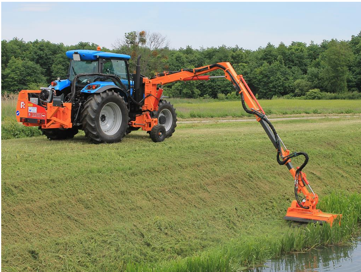
Slika 7. Održavanje kanala uz poljoprivredne površine

Košnja je jedna od najčešćih i učinkovitijih preventivnih mjera (Slika 7.). Ako se obavi prije početka generativne faze, možemo učinkovito smanjiti broj korova na nekim površinama. Najbolje je iskoristiva na antropogenim površinama poput cesta, kanala, jaraka, itd. Košnja nam isto omogućuje da iscrpimo biljku. Uništavanjem nadzemnoga dijela biljke, prisiljavamo tu biljku da nadoknadi izgubljenju stabljiku te ju tako možemo oslabiti da ne dođe do generativne faze.