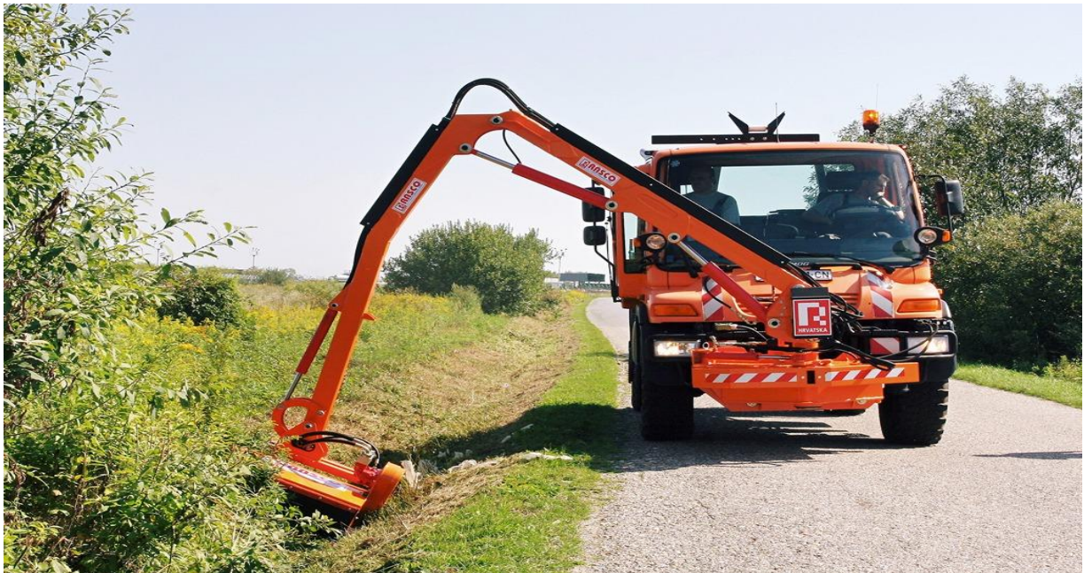
Slika 3. Košnja korova uz puteve

Zbog veličine korovnog zrna, to zrno se često može pomiješati sa zrnom kulturnih biljaka i tako se nekontrolirano širiti na druga polja. To možemo spriječiti uklanjanjem korova s polja prije žetve, a vrlo je važno i koristiti certificirano sjeme profesionalnih proizvođača. Ta sjemenska smjesa je nešto skuplja, ali nam daje garanciju da je čista od korovnih zrna i da je tretirana protiv ostalih štetnika. Ovo je jedan od najboljih načina u borbi protiv korova i bolesti.