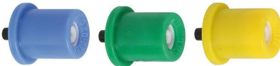
Slika 2. Lechler TR 80 mlaznice