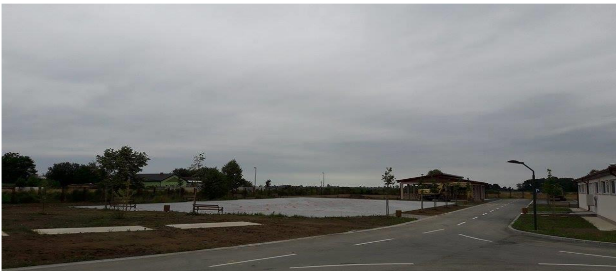
Slika 8. Izložbeni prostor, natkriveni prostor za stoku te interne prometnice i parkiralište