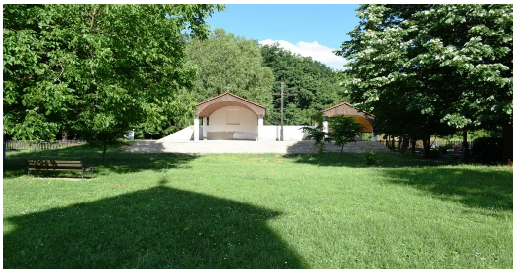
Slika 2. Svetište Šumanovci

Nematerijalnu kulturnu baštinu prvenstveno čini šokačka tradicija s bogatom folklorno-tradicijskom i etnološkom vrijednošću koju njeguju i promoviraju kulturno-umjetnička društva registrirana na području LAG-a, ali i brojne kulturno-tradicijske manifestacije poput Šokačkog sijela , Kruh naš svagdanji – žetve i vršidbe u prošlosti , Raspjevane Cvelferije i drugih . Na području LAG-a Šumanovci nalazi se najstarije svetište u Vukovarsko-Srijemskoj županiji – Svetište Majke dobre nade – Šumanovci po kojem je LAG i dobio ime, ali i brojne crkve te groblja sa značajnom povijesno-kulturnom vrijednošću od kojih su neke i zaštićene kao nepokretni spomenik kulture.