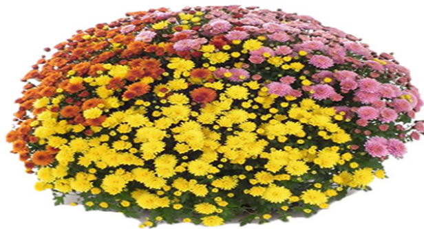
Slika 9. Krizantema Multiflora