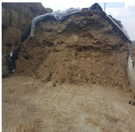
Slika 6. Prikaz silaže koja se koristi u hranidbi