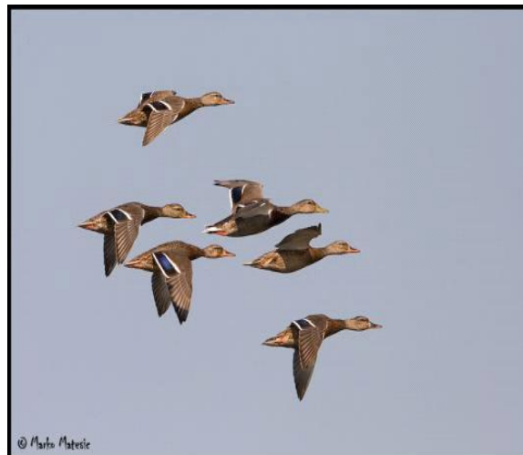
Slika 3. Migracije divljih pataka

Divlje patke žive u velim skupinama tj. jatima i radi toga se smatraju izrazito društvenim pticama. U svoje jato prihvaćaju sve pripadnike iz porodice pataka. U rezervatima i na ostalim mjestima gdje nije uznemiravana, ova je ptica aktivna i danju. Let divlje patke je brz i postojan. Tijekom migracija, njihov let poprima oblik slova V. Međutim, kod ptica koje su tijekom migracija uznemiravane, ova formacija nije konstantna već se od jedne bare do druge kreću u velikom jatu ili u isprekidanim redovima. Međutim, one također povremeno migriraju tijekom razdoblja duže zime kako bi pronašle zaklon duž nezaleđenih tokova velikih rijeka. Pridružuju im se jata ptica selica iz nordijskih zemalja koje se u kolovozu počinju spuštati u toplije krajeve. Migracije dosežu vrhunac koncem listopada, a povratak započinje tijekom siječnja ili veljače. (Durantel, 2007.).