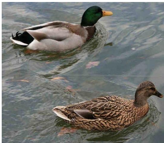
Slika 1. Ženka i mužjak divlje patke gluhare (Durantel, 2007.)

Divlje patke su jedna od najbrojnijih i najrasprostranjenijih skupina među lovnim vrstama ptica. Obitavaju na raznolikim tipovima vodenih staništa, od plitkih močvara, gdje su najbrojnije, do jezera, od potoka i kanala do velikih rijeka. Sve patke za mitarenja tijekom ljeta gube sva letna pera i oko mjesec dana ne mogu letjeti (Mustapić, 2004.). Divlje patke gluhare slove za najpoznatijeg pripadnika skupine plivačica. Za mužjake je karakteristično da za vrijeme parenja perje na glavi imaju sjajno zelene boje s bijelom prugom oko vrata, perje po tijelu je svijetlo sive boje, dok ispod vrata i na vratu dominiraju pera crne boje. Boja nogu je izrazito narančasta, a kljun je žuto zeleni. Ženke se razlikuju od mužjaka po izgledu, a nerijetko ih se smatra i neuglednijima od mužjaka. Razlika između perja ženke i mužjaka divlje patke prikazana je na Slici 1.