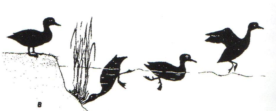
Slika 6. Siluete patke plivarice (Mustapić, 2004.)