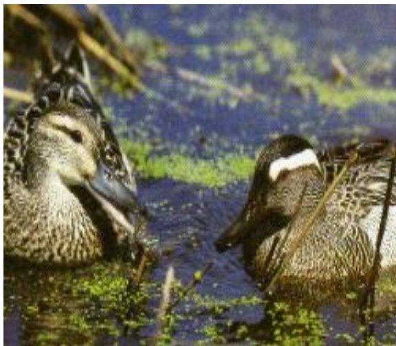
Slika 9. Patka pupčanica – ženka i mužjak (Mustapić, 2004.)

Patke pupčanice ( Anas querquedula ) obitavaju na prostorima močvara, a u razdoblju selidbe mogu se pronaći po rijekama i barama. Nešto je krupnija i izduženija od kržulje, mase 250 - 550 grama. Visoko čelo glavu joj čini uglatijom. Mužjak je lako prepoznatljiv po uočljivoj, širokoj i dugoj bijeloj nadočnoj pruzi. Lice je u mladih i ženki, nasuprot kržulji, isprugano, svijetlim mrljama na osnovu dužeg i šireg kljuna, nedostaje im bijela oznaka na osnovi repa vidljiva u kržulje. U letu se ženke i mlade sa sigurnošću mogu prepoznati po uočljivoj kombinaciji zelenog zrcala, s gornje u donje strane omeđenog podjednakim bijelim prugama i plavosivim prednjim dijelom krila odozgo. Najduži je zabilježeni vijek u prirodi deset godina (Mustapić, 2004.).