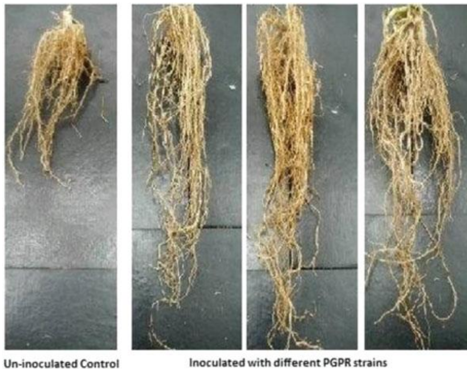
Slika 3. Utjecaj PGPR koje sadrže ACC deaminazu na rast korijena kukuruza u uvjetima salinitetnog stresa (Nadeem, 2013.)

Slično tome, prisutnost drugih svojstava kao što su indol-3- octena kiselina, proizvodnja siderofora, topivost fosfata, proizvodnja fitohormona povoljno djeluju na toleranciju stresa biljaka. proizvodnja antioksidativnih enzima štite biljku od štetnog utjecaja reaktivnih kisikovih radikala (Goswami, 2016.). Kao odgovor na stvaranje radikala biljka proizvodi antioksidativne enzime kao što su superoksid dismutaza, peroksid dismutaza, katalaza i glutathion reduktaza (Arora i sur., 2002.). Inokulacija s korisnim mikroorganizmima pojačava aktivnost ovih enzima i pomaže im smanjiti utjecaj stresa (Fu i sur., 2010.).