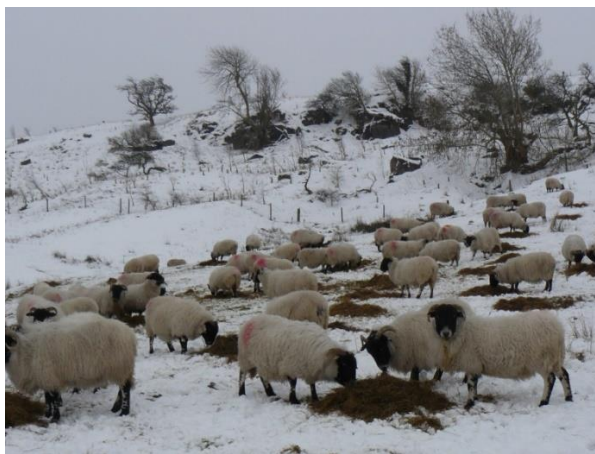
Slika 6. Ekstenzivan uzgoj ovaca

Ulaganja u proizvodnju su relativno niska, te se ovaj sustav svrstava u nomadsko ovčarstvo. Ekstenzivni sustavi danas nisu toliko zastupljeni kao nekad, međutim postoje države u čijim regijama se i danas uzgajaju na ovaj način. Neke od njih su: Francuska, Portugal, Rusija i Španjolska. Ovce se napasuju cijele godine, osim u vrijeme nepovoljnih vremenskih prilika.