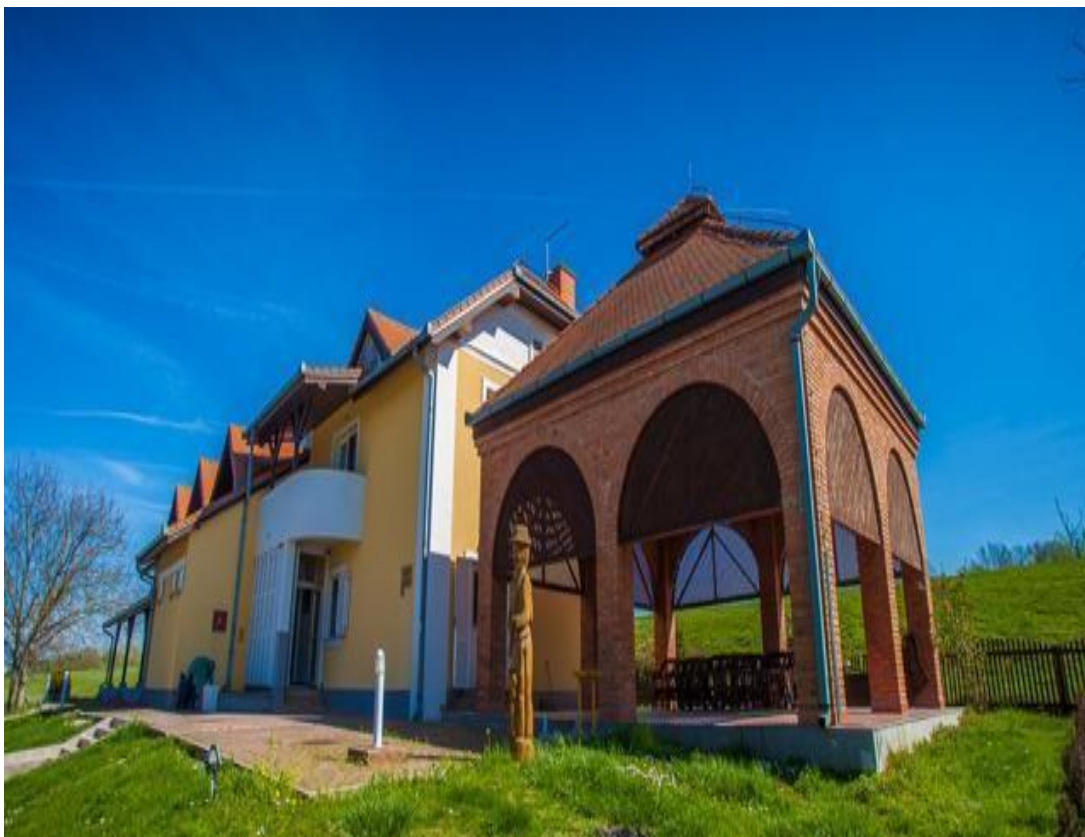
Slika 3. Lovački dom Zlatna greda

Lovački dom Zlatna greda, jedan od najljepših lovačkih domova u vlasništvu Hrvatskih šuma. Smješten je u Baranji uz sam dunavski nasip u Lovištu Podunavlje-Podravlje koje predstavlja jedno od najvažnijih europskih lovišta poznato po ritskim šumama uz Dravu i Dunav te po bogatstvu krupne divljači posebno jelena i divlje svinje te predstavlja biser hrvatske lovne ponude. Posebno je upečatljiva rika jelena u ritu, te skupni lov na divlje svinje. Udaljen je 3 km uskom asfaltnom cestom od Zlatne Grede u Baranji. Otvoren je 2000. godine i od tada njime uspješno gospodari Uprava šuma podružnica Osijek, šumarija Tikveš.