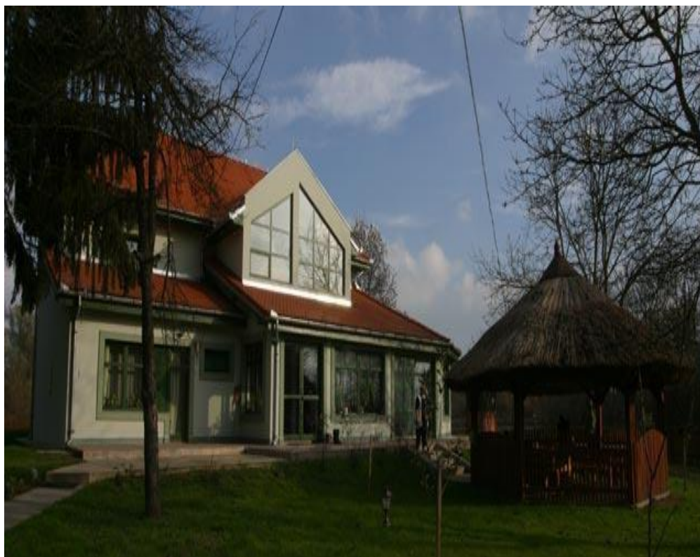
Slika 4. Lovački dom Čošak šume

Nedaleko poznatog dvorca Tikveš iz austrougarskog doba, u lovištu Podunavlje-Podravlje, poznato po bogatstvu krupne divljači, posebno jelena i divlje svinje, smješten je lovački dom Čošak Šume, okružen neponovljivim šumskim krajolikom. Gostima se na jelovniku nude nadaleko poznati i priznati baranjski specijaliteti u mirnoj i ugodnoj domaćoj atmosferi.