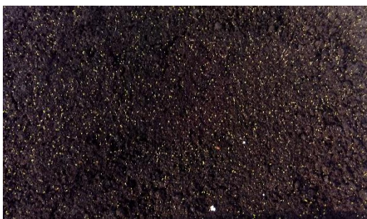
Slika 7. Klijanci smilja.

Važno je kod proizvodnje presadnica imati na umu da je za proizvodnju 1 ha nasada smilja potrebno oko 60 g sjemena (sjetva na oko 10 m 2 hladnog klijališta).