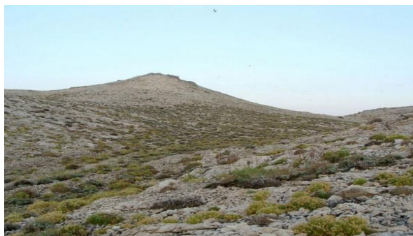
Slika 4. Samoniklo smilje (Foto original).

Obzirom na prepoznata brojna pozitivna svojstva biljke, smilje se od davnina prikuplja (Stanković i su., 2001.). S porastom komercijalnih potreba za ovom biljkom sve je više sakupljača te se Zakonom o zaštiti prirode propisalo uvjete sakupljanja smilja kako bi se vrsta očuvala. Ovim zakonom vremenski je ograničen period u kojem se smilje smije prikupljati. Temeljem mišljenja Državnog zavoda za zaštitu prirode sakupljanje smilja na području Dubrovačko neretvanske županije, otocima Splitsko-dalmatinske, Šibensko-kninske i Zadarske županije te na području otoka Paga odobreno je od 1. lipnja do 1. kolovoza, a na ostalim područjima od 15. lipnja do 15. kolovoza (Mucalo, 2015.).