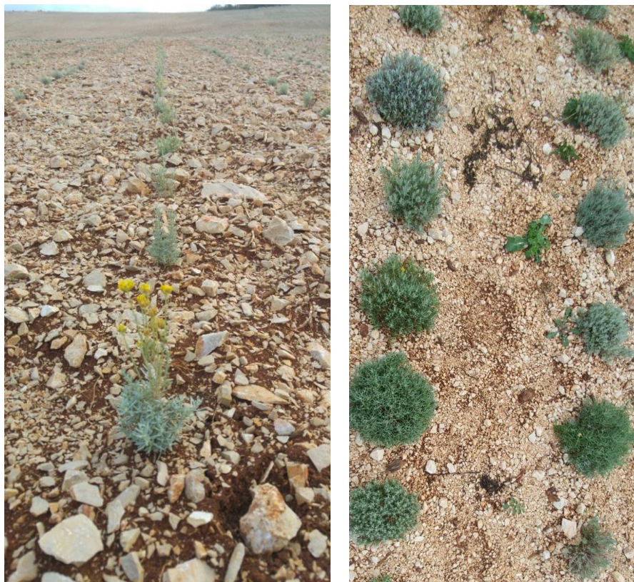
Slika 11. Mladi nasadi.

biljkama u redu 30-40 cm (Slika 11). Za sadnju jednog hektara nasada potrebno je osigurati oko 35000 presadnica (sadnja u redovima razmaka 70 cm te razmaka među biljkama u redu 40 cm).