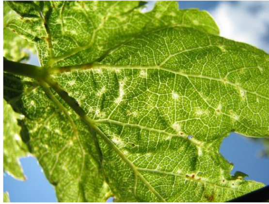
Slika 12. Lozina grinja – uzročnik akarinoze