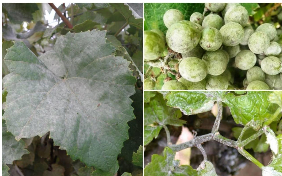
Slika 4. Pepelnica vinove loze