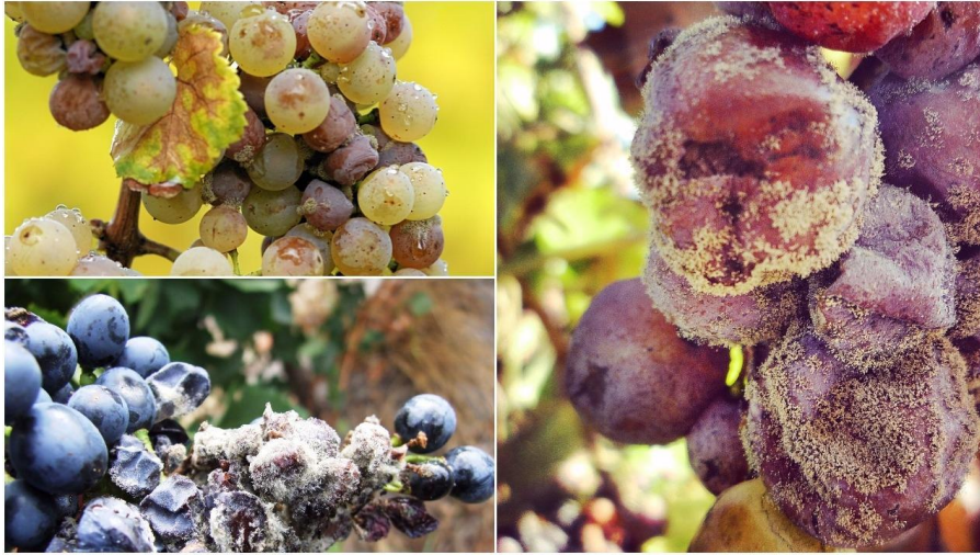
Slika 5. Siva plijesan vinove loze