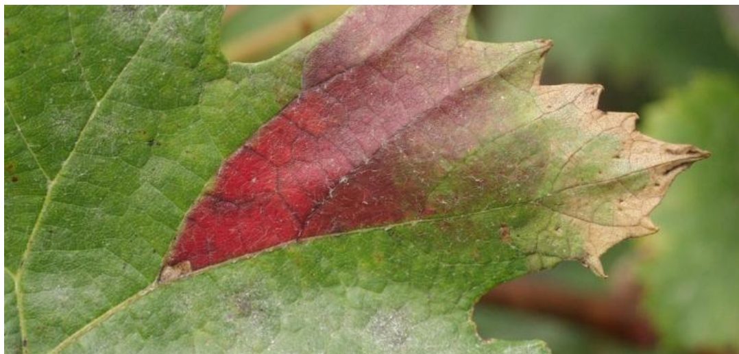
Slika 9. Crvena palež na listovima vinove loze

SIMPTOMI: Pojavljuju se žućkaste pjege, kod bijelih sorti kasnije posmeđe, kod crnih postaju tamno crvene. Lišće se suši, a zatim otpadne.