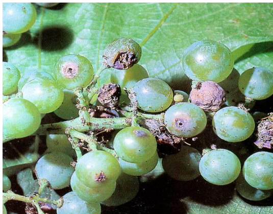
Slika 15. Šteta od pepeljastog groždanog moljca