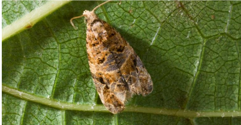
Slika 14. Pepeljasti grozdov moljac

generaciju gusjenica što više, da druga bude manja. Prednost treba dati onim insekticidima koji ne povećavaju mogućnost pojave crvenog pauka i poštedeju prirodne neprijatelje.