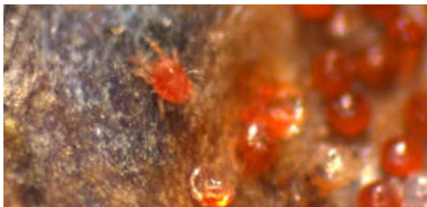
Slika 10. Imago i jaja crvenog voćnog pauka

Preporuča se zimsko prskanje kada se na jednom dužnom metru nađe 500 – 1000 jaja. U vrijeme razvoja izboja, suzbija se kada je već zaraženo 60 - 70% listova, a ljeti 30 – 45% listova (Brmež i sur., 2010.).