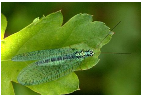
Slika 12. Mrežokrilka, vrsta C. perla .