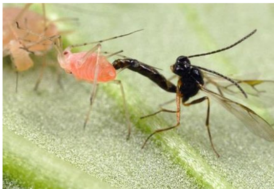
Slika 14. Vrsta iz porodice Braconidae.

navode ove vrste te vrstu Aphidius hieraciorum Starý kao značajne u suzbijanju lisnih ušiju, posebice zelene breskvine uši i lisnih ušiju na salati i dinji u Španjolskoj.