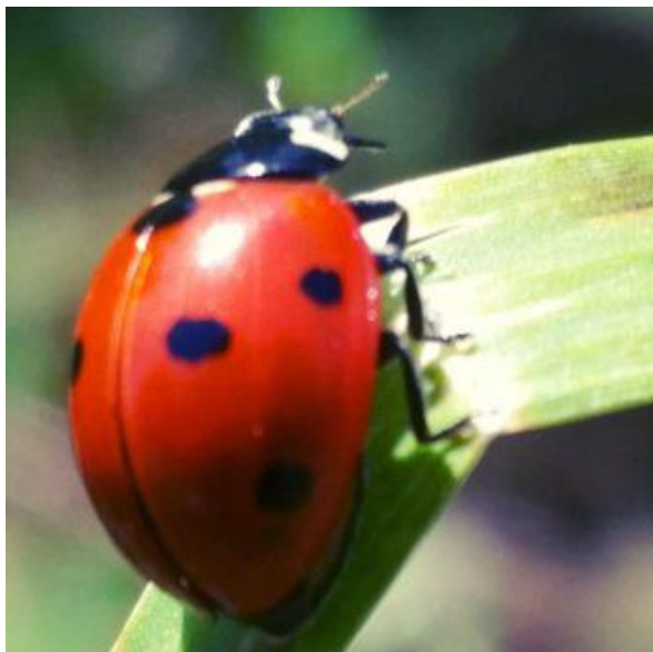
Slika 4. Božja ovčica C. septempunctata .

u Hrvatskoj je prvi put utvrđena 2010. godine. Međutim, pokazala se izrazito polifagna i proždrljiva. Duga je 6 – 8 mm, a napada gotovo sve vrste kukaca koje su manje od nje pa tako i ličinke autohtonih vrsta božje ovčice.