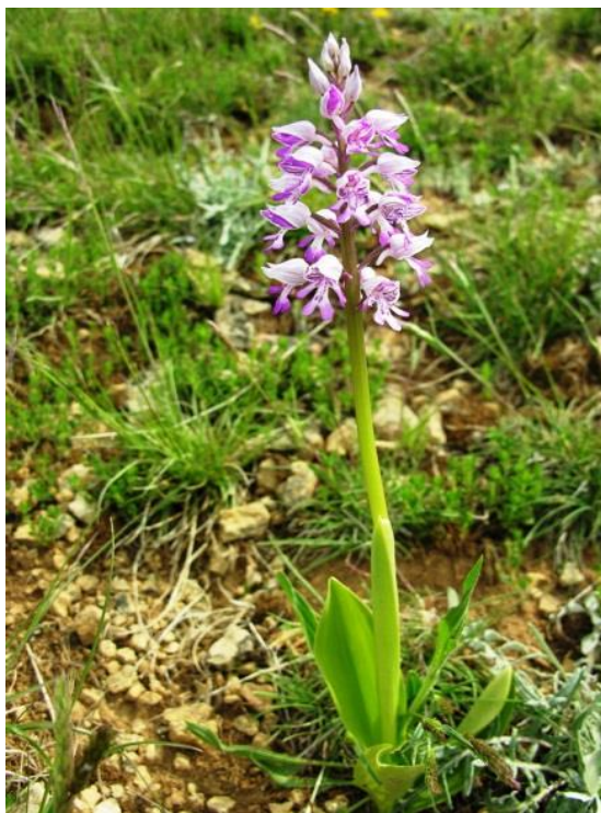
Slika 22. Orchis militaris L.

Rastu na travnjacima, šumskim čistinama i u svijetlim šumama. Cvatu od svibnja do kolovoza.