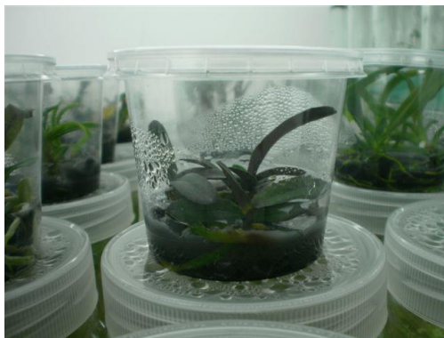
Slika 34. Pupaljci za razmnožavanje

Orhideje je vrlo teško razmnožiti. Jedan od najjednostavnijih načina je vegetativno razmnožavanje. Metoda vegetativnog razmnožavanja "in vitro" je način na koji se iz malih dijelova tkiva (Slika 34. i Slika 35.) ili stanica na hranjivoj podlozi i u sterilnim uvjetima mogu uzgojiti mali izdanci i biljčice ( http://www.horti-kultura.hr/biljke-iz-staklenke-kultura-tkiva-i-stanica-in-vitro/ ). Moguće je od jedne majčinske biljke proizvesti i do 20 milijuna sadnica. Zanimljivo je da se biljne vrste kojima u prirodi prijeti izumiranje također mogu uzgojiti na ovaj način. Metoda kulture tkiva i biljnih stanica "in vitro", koriste se za biljne vrste, najčešće one koje se teško razmnožavaju vegetativnim putem, one koje stvaraju manju količinu sjemena i čije sjeme ima slabu klijavost. Orhideje se mogu vegetativno razmnožiti samo na ovaj način. Iako orhideje stvaraju velike količine sjemena, njihovo sjeme može klijati samo u simbiozi sa gljivama. Sjeme orhideja uopće nema ili ima vrlo mali endosperm, te s pomoću gljiva one osiguravaju hranjiva za klijanje. Zbog toga im je potrebna simbioza. Metodom "in vitro" hranjiva podloga nadoknadi potrebne hranjive tvari.