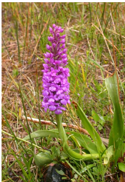
Slika 13. Gymnadenia conopsea (L.) R.