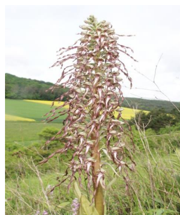
Slika 17. Himantoglossum hircinum (L.) Spreng