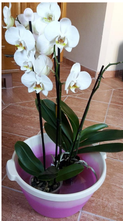
Slika 39. Zalijevanje orhideja