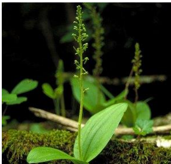
Slika 19. Listera ovata L.