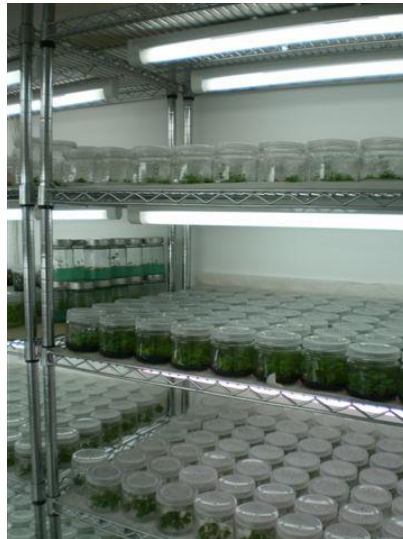
Slika 38. Klima komora

Nakon sterilizacije, pripremaju se majčinske biljke za uvođenje u kulturu. Odabrane biljke moraju biti zdrave i sortno čiste. Zatim se priprema početni materijal za razmnožavanje (eksplantat). Eksplantat se mora brzo prebaciti na pripremljenu podlogu kako ne bi došlo do sušenja tkiva. Staklenke se slože u klima komore (Slika 38.) i tamo započinje proces razmnožavanja.