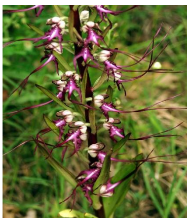
Slika 16. Himantoglossum caprinum (L.) Spreng.