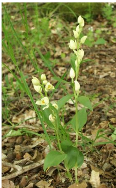
Slika 3. Cephalanthera damasonium (Mill.) Druce

Sve tri vrste su prema IUCN-u 1 ugrožene.