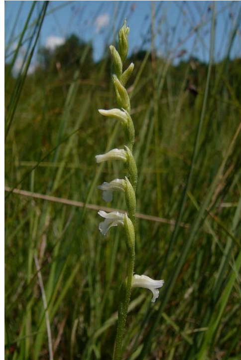
Slika 24. Spiranthes aestivalis (Poir.) Rich