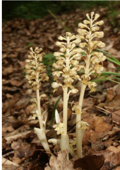
Slika 20. Neottia nidus-avis (L.) Rich.