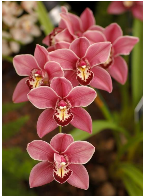
Slika 26. Vrsta roda Cymbidium

Listovi su dugi i zeleni, a stabljika je visoka 60 do 80 centimetara. Cvjetovi su veliki zbog čega se najviše cijene i često koriste kao rezano cvijeće. Zanimljivo je za vrste ovog roda da mogu preživjeti niske temperature, te cvjetaju zimi kada veći dio orhideja ne cvjeta. Rod Cymbidium (Slika 26.) broji oko 52 vrste. Rastu u tropskoj i subtropskoj aziji (Borneo, Filipini, Sjeverna Indija, Kina, Japan), ali i u sjevernoj Australiji gdje rastu na većim visinama i u hladnijim uvjetima.