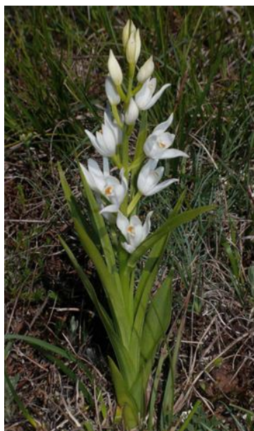
Slika 4. Cephalanthera longifolia (L.) Fritsch