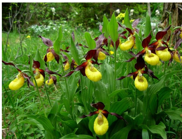
Slika 6. Cypripedium calceolus L.

U Hrvatskoj je jedina vrsta Cypripedium calceolus L. (Slika 6.). Ovo je vrsta koja ima najneobičnije i najveće cvjetove. Uspravna stabljika, visoka 15 do 60 centimetara, koja izraste iz razgranatog podanka, a na vrhu stabljike razvija 1 - 2 velika cvijeta, ugodnog je mirisa (poput marelice). Medna je usna mjehurasto napuhana i podsjeća na papučicu, zlatne je ili limunasto žute boje. Listovi su ušiljeni sa izraženim žilama. Raste na sjenovitim i vlažnim mjestima i na čistinama gorskog područja. Također spada u ugrožene vrste, ali je i zaštićena Zakonom o zaštiti prirode (6.7.1972., NN 42/72). Cvate u svibnju i lipnju.