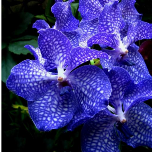
Slika 33. Vrsta roda Vanda