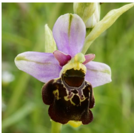
Slika 21. Ophrys fuciflora Haller