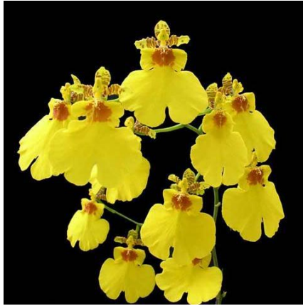
Slika 30. Vrsta roda Oncidium