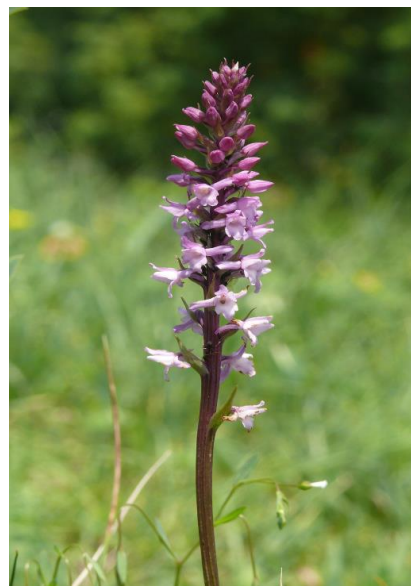
Slika 14. Gymnadenia odoratissima (L.)

http://www.orchidmeadow.co.uk/gallery.html )