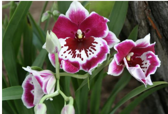
Slika 29. Vrsta roda Miltonia

Ovdje se ubrajaju biljke koje se nazivaju orhideje mačuhice (Slika 29.). Listovi orhideja mačuhica su dugi i rastu u paru, a cvjetovi su jako široki i potpuno plošni. Cvjetovi traju otprilike 5 tjedana. Prirodna staništa su vruće i vlažne šume Brazila a jedna vrsta nađena je u Peruu. Rod broji oko 10 vrsta.