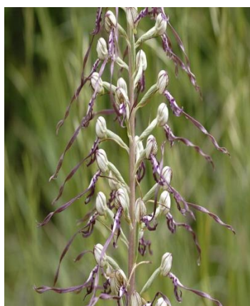
Slika 15. Himantoglossum adriaticum (L.) Spreng.