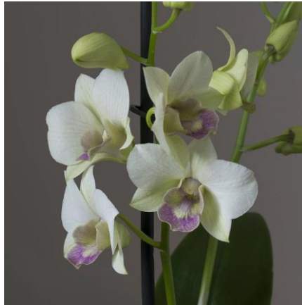
Slika 27. Vrsta roda Dendrobium

uzimaju dugu pauzu, a tijekom ljeta rastu. Staništa su im u istočnoj i jugoistočnoj Aziji, sjevernoj Australiji i Novom Zelandu. Rod Dendrobium (Slika 27.) broji oko 1200 vrsta.