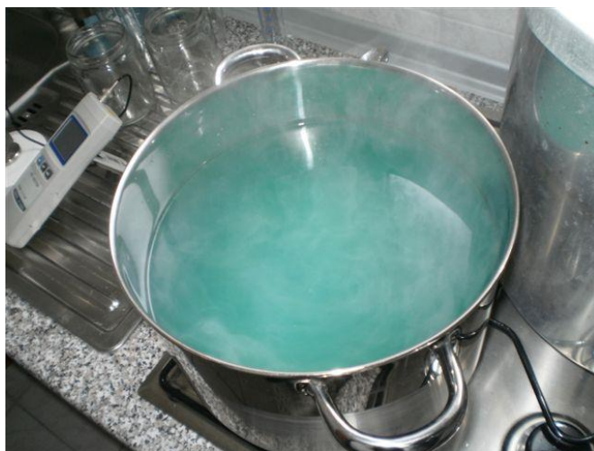
Slika 36. Lužina

Prvo se mora pripremiti hranjiva podloga za razmnožavanje (Slika 36.). Kemijski sastav podloge je različit, ovisno o biljnoj vrsti. Podloga u pravilu sadrži: organske tvari, vitamine, makro i mikroelemente, biljne hormone i agar. Bitan je i omjer biljnih hormona, jer utječe na razvoj i formiranje stanica izdanka, kalusnog tkiva ili korijena. Hranjiva podloga sadrži fitohormon citokinin koji pospješuje stvaranje postranih pupova. Sastojci se zagrijavaju na temperaturi od 95°C do 98°C prema određenoj recepturi. Mjeri se pH vrijednost koja treba iznositi oko pH 5 do pH 6. Dodavanjem kiseline ili lužine vrši se korekcija pH vrijednosti.