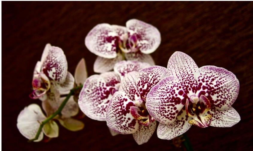
Slika 32. Vrsta roda Phalaenopsis

Orhideje roda Phalaenopsis (Slika 32.) uglavnom rastu na drvetu ali ima vrsta koje rastu u stijenama. Cvjetovi dugo traju, a neke vrste imaju šareno lišće pa su zanimljive i kada ne cvjetaju. Orhideje ovog roda je vrlo jednostavno uzgajati u domaćinstvima. Rastu u jugoistočnoj Aziji, Indoneziji, Indiji, Maleziji i Filipinima.