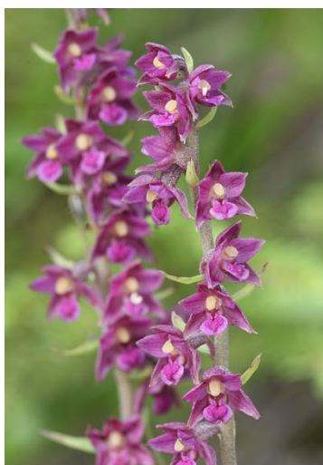
Slika 9. Epipactis atrorubens

Raste u bukovim šumama i šumama brdskog područja. Cvate od lipnja do rujna.