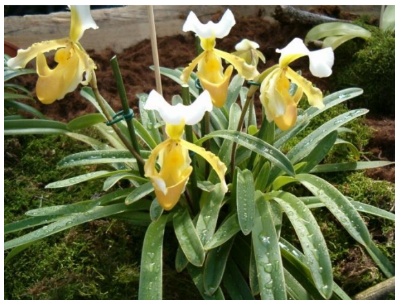
Slika 31. Vrsta roda Paphiopedilum

Medna usna roda Paphiopedilum (Slika 31.) podsjeća na papučicu, te su po tome i dobile ime, a služi za primamljivanje kukaca. Prirodna staništa su u Indiji, jugoistočnoj Aziji, Kini, Tajlandu i Filipinima. Rod broji oko 60 vrsta.