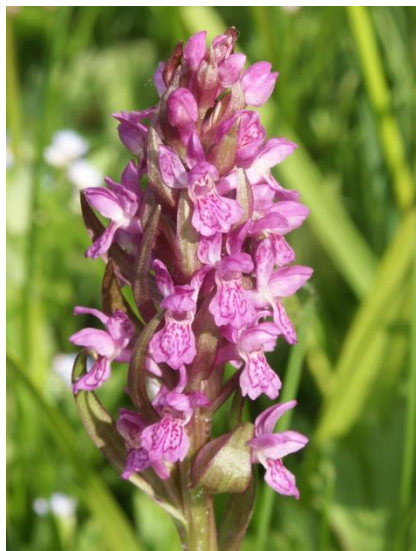
Slika 7. Dactylorhiza incarnata (L.) Soo.

Rastu na suhim i močvarnim livadama, te kamenjarskim travnjacima. Cvatu od svibnja do srpnja.