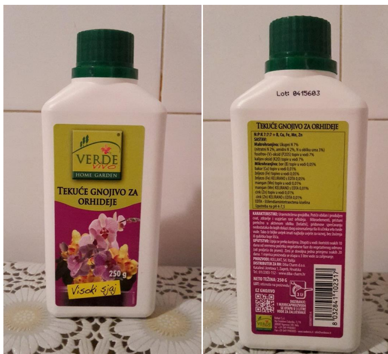
Slika 40. Tekuće gnojivo za orhideje

Sve orhideje zahtjevatu prihranu i to najčešće u obliku tekućeg gnojiva (Parađiković, 2015.). Biljci tekuće gnojivo (Slika 40.) dodajemo prilikom zalijevanja. Kada je orhideja u fazi mirovanja, prihranjuje se svaka dva tjedna ili rijeđe, a kada je u fazi intenzivnog rasta i cvatnje, prihranjuje se jednom tjedno, ovisno o vrsti.