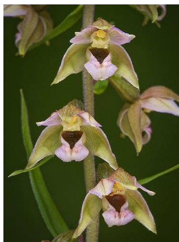
Slika 10. Epipactis helleborine