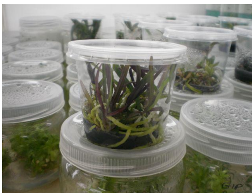
Slika 35. Pupaljci za razmnožavanje