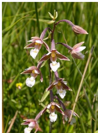
Slika 12. Epipactis palustris