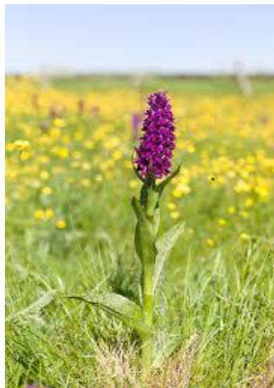
Slika 8. Dactylorhiza majalis (Rchb.) P.F. Hunt et Summerh