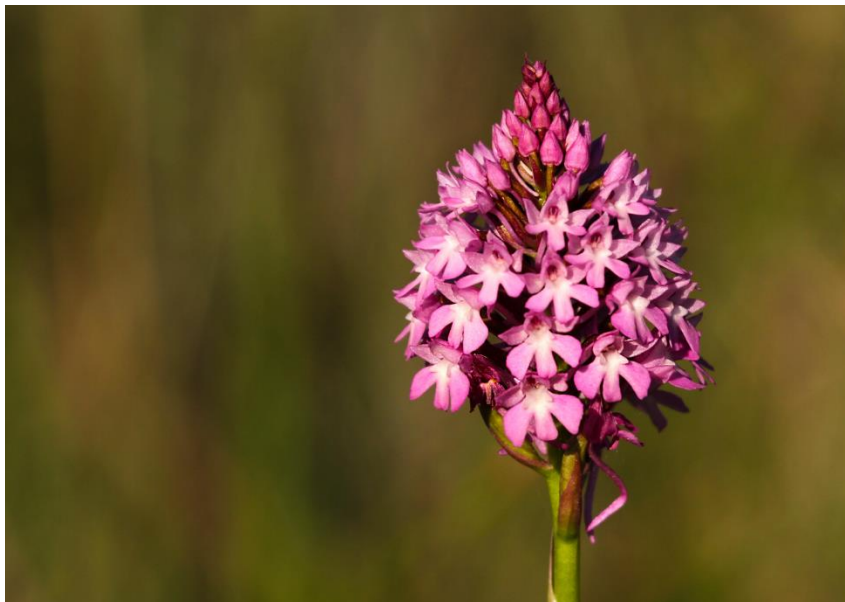
Slika 2. Anacamptis pyramidalis (L.) Rich

Rod ima samo jednu vrstu, a to je Anacamptis pyramidalis (L.) Rich, (Slika 2.). Ime je dobila zbog piramidalnog izgleda cvata. Iz okruglih gomolja izraste stabljika visoka 20 - 80 centimetara s 4 do 10 ravnih listova. Cvjetovi su ugodnog mirisa, crvene do ružičasto crvene boje, s trodijelnom mednom usnom. Raste uz grmlje ili rub šume te na kamenjarskim, sunčanim travnjacima. Cvate od travnja do kolovoza.