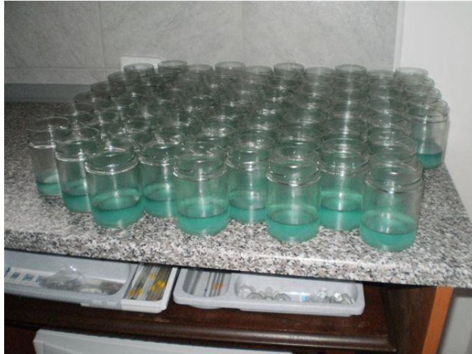
Slika 37. Priprema za sterilizaciju