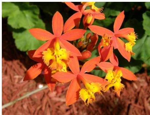
Slika 28. Vrsta roda Epidendrum

Samo ime Epidendrum (Slika 28.) govori da rastu na drveću. Broj i boja cvjetova ovisi o vrsti, a mogu biti orhideje sa pojedinačnim cvjetovima i orhideje sa mirisnim cvatovima. Rasprostranjene su od Južne Karoline do Argentine. Broje oko 750 vrsta.