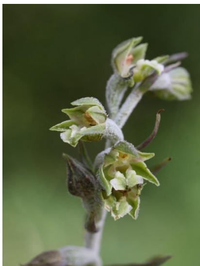
Slika 11. Epipactis microphylla