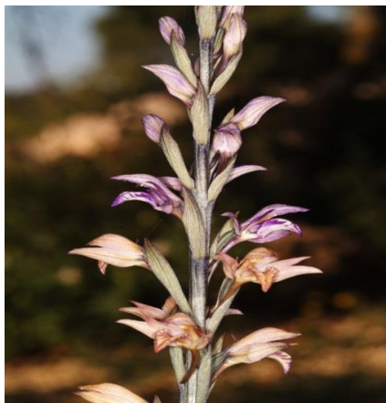
Slika 18. Limodorum abortivum

je da sama biljka, za vrijeme sušnih mjeseci, nije sposobna probiti sloj zemljine kore, te razvija sjemenke i cvate ispod zemljine kore. Cvate od svibnja do srpnja.