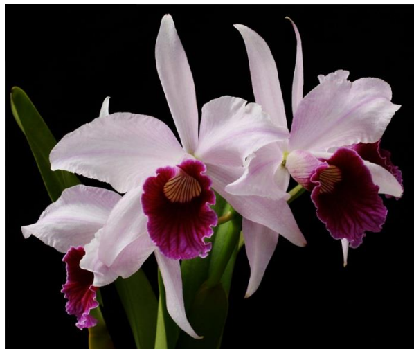
Slika 25. Vrsta roda Cattleya

Vrste roda Cattleya (Slika 25.) su litofiti, odnosno rastu na stijenama. Imaju iznimno velike cvjetove zbog čega su uzgajivačima omiljene i često se koriste kao rezano cvijeće. Ime su dobile po Williamu Cattleyu koji je prvi uzgojio vrstu Cattleya labiata u 19. stoljeću. Rod ima 42 vrste koje rastu od Kostarike do Južne Amerike.