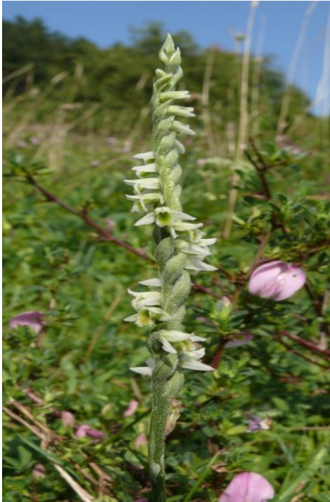
Slika 23. Spiranthes spiralis (L.) Chevall