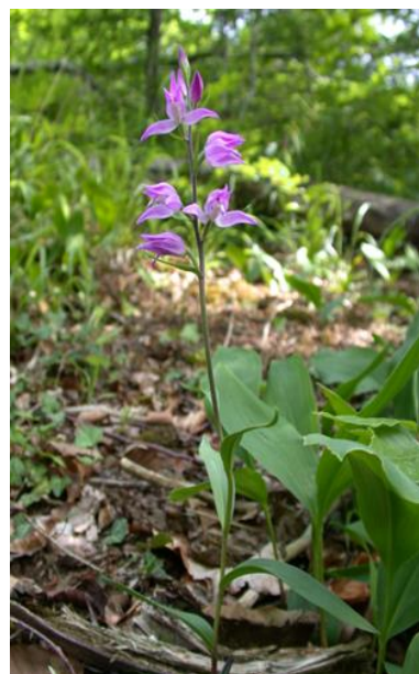
Slika 5. Cephalanthera rubra (L.) Rich