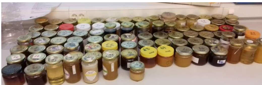
Slika 4. Skladišteni med prije analize

Posebnu pažnju treba obratiti na skladištenje meda. Med treba čuvati u čistim, suhim i tamnim prostorijama s dobrim provjetranjem. Prostorija ne smije biti vlažna jer med lako upija vlagu te stoga lako prihvaća druge mirise. Isto tako med ne treba čuvati na niskim temperaturama. Najpovoljnija temperatura je od 17 do 19° C. Ukoliko je med proizveden prema pravilima struke vlaga ne smije prelaziti 20% (ovisno o vrsti meda). U tim uvjetima opstanak bakterija i gljivica gotovo je nemoguć. Osim što nije preporučljivo med čuvati u metalnim posudama (zbog reakcije organskih kiselina i metala), pri konzumaciji meda preporuča se korištenje plastičnog, drvenog ili porculanskog pribora. Nema na svijetu pčele koja proizvodi loš med, loš med rezultat je industrijskog punjenja meda ili nesavjesnog i neobrazovanog pčelara.