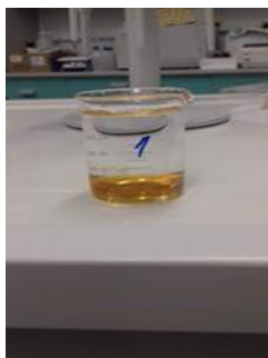
Slika 5. Otopljeni uzorak meda

Prazna staklena čaša se izvažuje na digitalnoj vagi koja se tarira kako težina čaše ne bi bila uračunata u odvagu. U tu istu staklenu čašu odvažuje se 20 g meda, koji će se analizirati. Izvagani uzorak meda otopi se u čaši dodavanjem 80 ml destilirane vode odvojene u menzuri. Otapanje se ubrzava miješanjem staklenim štapićem ili magnetnom mješalicom. Ravnomjerno otopljen uzorak je spreman za analizu.