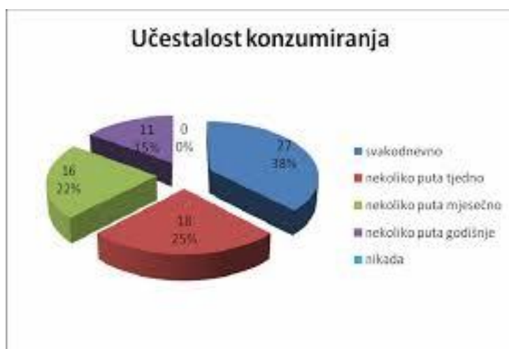
Slika 12. Učestalost konzumiranja meda;

Eksperimentalni rezultati su pokazali da otopine svjetlijih medova imaju niži izmjereni pH, što im daje veću kiselost u usporedbi sa medovima tamnije boje. Električna provodljivost, a paralelno s njom i sadržaj pepela u tamnijim medovima su veći, osobito u medljici.