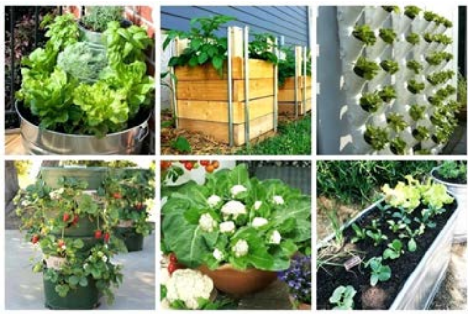
Slika 15. Posude sa povrćem u vertikalnom vrtu

prostoru može se uzgajati veliki broj biljaka, ukrasnih i jestivih. Sljedeća prednost je nepostojanje korova jer je tlo u posudama sterilno i nema sjemenki korova koje bi proklijale. Zalijevanje posuda je jednostavno, ali tlo u posudama ima tendenciju brzog isušivanja. Prilikom odabira veličine posude, treba imati na umu veličinu korijenovog sustava biljke koja se uzgaja, te što je posuda veća to će uzgoj biti uspješniji. Posude (slika 15.) možemo osigurati tako da djelomično zakopamo posudu u tlo ili stabiliziramo stranice ciglama (McLaughlin, 2012.).