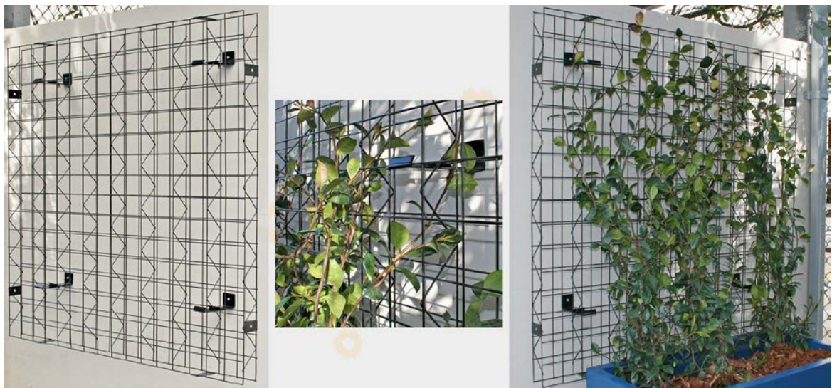
Slika 3. Modularni sustav panela

Prednosti ovog sustava su mogućnost mijenjanja veličine mreže, modularna konstrukcija, jednostavna instalacija te izdržljivost panela.