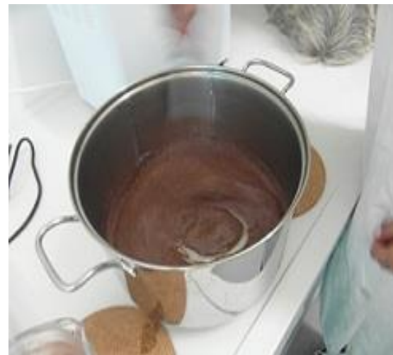
Slika 20. Smjesa nakon dodanog mlijeka u prahu i kakaa (Janković, 2019.)