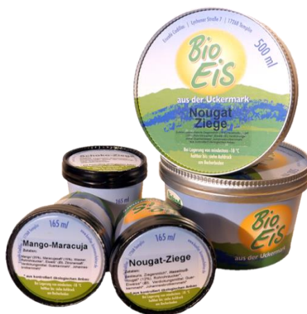
Slika 10. Pakiranje sladoleda

Proizvodnja kobiljeg mlijeka počela se razvijati u drugoj polovici prošlog stoljeća. U Njemačkoj je registrirano oko 40 gospodarstava koji se bave proizvodnjom kobiljeg mlijeka (Gregić i sur., 2018.a). Njemački slastičar Koller u svoje proizvode dodaje kobilje mlijeko. Proizvodi sladoled i distribuira ga na tržište po cijeloj Njemačkoj. Njegov asortiman sadrži više od 60 različitih vrsta sladoleda koji se proizvodi ručno prema staroj tradiciji. Koller koristi prirodne sirovine od ekoloških uzgoja kao što su voće i povrće za veganske sladolede. Proizvodi sladoled od ovčjeg, kozjeg i kobiljeg mlijeka. Mlijeko za pripremu sladoleda nabavlja izravno s poljoprivrednih gospodarstava, koja su specijalizirana za proizvodnju organskog mlijeka. Koller proizvodi razne kreacije sladoleda kao što su maline s fermentiranim kobiljem mlijekom ili sladoled od ovčjeg mlijeka s ružičastim paprom. Sladoled se pakira u šalice kapaciteta 500 i 165 ml ( https://koeller-organic-manufactory.de/koeller.icecream.html ).