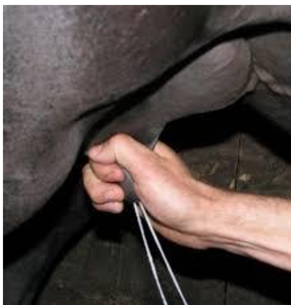
Slika 1. Ručna mužnja kobila

Mlijeko iz sise se izmuzuje u posudu laganim stiskom između palca i kažiprsta u njenom bazalnom dijelu i povlačenjem prema vrhu sise (Alatrović i sur., 2017.). Izmuzuje se i u vidu dva mliječna mlaza radi postojanja dva sisna kanala u svakoj sisi. Postupak se ponavlja sve do završetka mužnje. Tijekom mužnje prvo se izmuzuje mlijeko iz cisterne sise i vimena, potom iz kanala i alveola vimena. Stoga se tijekom mužnje uočava prva faza mužnje u kojoj se izmuzuje mlijeko iz cisterni, zatim slijedi jedna kraća faza „slijepe mužnje“ u kojoj djelovanje oksitocina nije izraženo te slijedi drugi val alveolarnog mlijeka koje se sintetizira u vimenu neposredno tijekom mužnje pod utjecajem oksitocina (Ivanković i sur., 2014.).