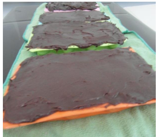
Slika 24. Ulijevanje smjese u kalupe (Janković, 2019.)