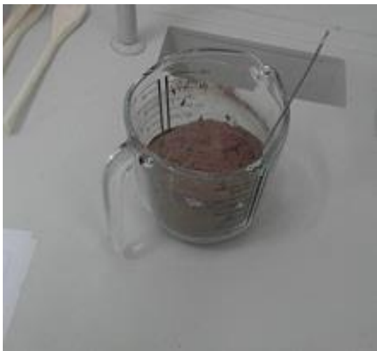
Slika 19. Pomiješano kobilje mlijeko u prahu i kakao (Janković, 2019.)