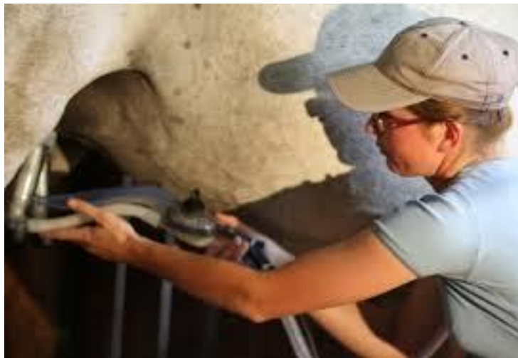
Slika 2. Strojna mužnja kobilu