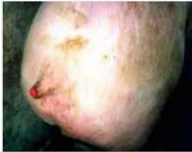
Slika 13. Griženje repova kod svinja