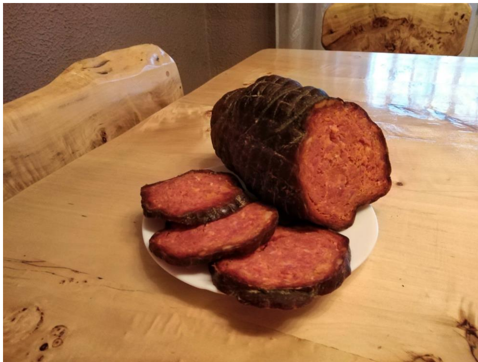
Slika 9. Suhomesnati proizvod od svinja uzgojenih na OPG-u Snežana Nešković