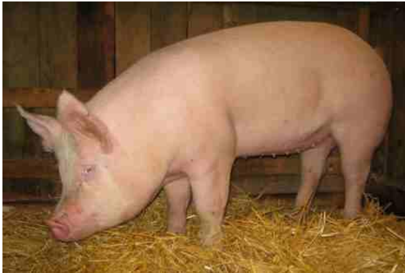
Slika 1: Svinja jorkšir pasmine

Veliki jorkšir - najraširenija pasmina svinja u svijetu. Nastala u Engleskoj. Velikog okvira, dug i dubok trup, obrasla je finom čekinjom bijele boje, uši su uzdignute prema gore. Plodnost krmača je vrlo dobra i kreće se 11 - 13 prasadi u leglu. Krmače su izrazito dobre majke i mliječnost im je velika. Tovljenici ostvaruju relativno visok prosječni dnevni prirast u tovu od 800 - 850 g uz utrošak hrane ispod 3 kg za kilogram prirasta. Postotak mišićnog tkiva u polovicama kreće se od 55 - 60%. U tovu sa 6 - 7 mjeseci starosti tovljenici postižu težinu od 100 do 110 kg. Općenito se može reći da je to univerzalna pasmina snažne konstitucije pogodna za namjene u uzgojnom i proizvodnom pogledu. U križanjima sa drugim pasminama korist se kao majčinska pasmina.