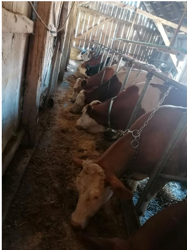
Slika 3. Krave u staji

Broj krava se vrlo brzo povećava, što iz razloga jer je kupljeno nekoliko visoko gravidnih junica tako i jer imamo nekoliko vlastitih junica koje su gravidne. Isto tako smo postigli rekordan broj teladi kojih je sada trenutno 10, a kroz mjesec dana bi se taj broj trebao povećati za još tri teleta. Uz goveda na gospodarstvu ima i nekoliko svinja, no one se koriste za vlastite potrebe.