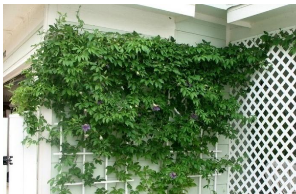
Slika 2. Passiflora incarnata snažna penjačica

Passiflora incarnata - ljubičasta pasiflora je višegodišnja snažna penjačica (Slika 2), koja je autohtona u Južnoj i Sjevernoj Americi. Ova penjačica penje se pomoću vitica (Slika 3) koje izrastaju u pazušcu lista. Može narasti od 2-6 m.