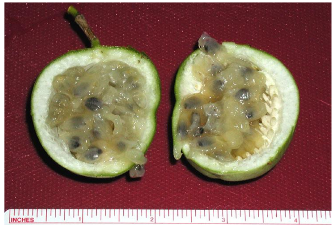
Slika 11. Plod sa sjemenkama i usplođem