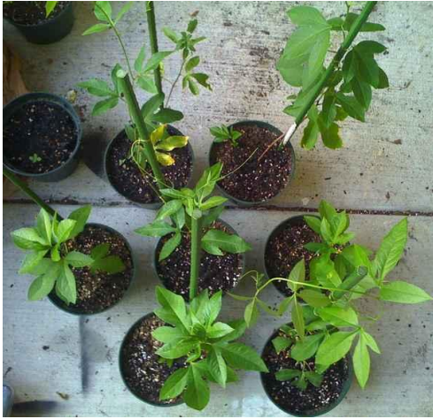
Slika 31. Passiflora incarnata uzgojena iz reznica 1