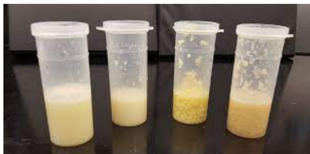
Slika 4: Primjer testiranja srednjeg kliničkog mastitisa u mlijeku krava

dnevnim dodatkom selen. Dnevni dodatak s 5 mg natrijevog selenita, započet 30 dana prije teljenja, smanjuje učestalost kliničkog mastitisa u 12 tjedana laktacije za 38% (Paschoal i sur., 2003.).