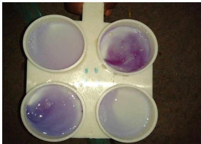
Slika 5: Primjer uzorkovanja mlijeka u plitkicu na mastitis test - Kalifornijski mastitis test

Skupina krava tretiranih anorganskim selenom imala je 20% porasta u slučajevima negativnog kalifornijskog mastitis testa između predeksperimentalne i eksperimentalne faze, mijenjajući se sa 15 na 18 četvrtina vimena bez subkliničkog mastitisa. Tretman organskim selenom promijenio se s 12 negativnih slučajeva u predeksperimentalnoj fazi na 5 slučajeva nakon unosa suplementa (58,3%).