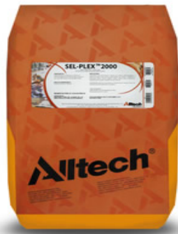
Slika 2: Izgled pakiranja kvasca s dodatkom selena, Sel-Plex, Alltech

U što boljem razumijevanju i tumačenju teme ovog diplomskog rada poslužit ćemo se nekim primjerima istraživanja učinka selena u hranidbi goveda kako na proizvodnju mlijeka, tako i na zdravlje. Kao dobar primjer provedbe pokusa prikazano je istraživanje provedeno u Brazilu na Institutu zootehnike, u Novoj Odessi, San Paulo (Oltramari i sur, 2014.). U pokusu su bile 24 krave u laktaciji (Holstein i Brown Swiss), prosječne tjelesne mase 600 kg s dnevnom prosječnom proizvodnjom mlijeka od 18,1 kg. Krave su bile smještene u slobodnu staju, dužine 36 i širine 12 m, s otvorenim stranama 3,80 m i puni pod, bez ventilatora i prskalica. Hranilica je bila iste duljine kao i staja, sa šest pojilica i 28 odmorišta. Krave su bile podijeljene u dvije skupine, prema pasmini, prema broju laktacije i razdoblju laktacije. Prije početka eksperimenta, izveden je Kalifornijski mastitis test, te je statistička analiza pokazala kako nema razlike u zdravlju vimena između te dvije skupine. Obrok se sastojao od kukuruza, sojine sačme, cijelog sjemena pamuka i silaže kukuruza. Sve krave su hranjene identično izmiješanom hranom, s 0,278 \text{ mg.kg}^{-1} ST selena dodanog iz dva različita izvora: kvasac selena ( 278 \text{ mg.kg}^{-1} ST Sel-Plex, Alltech, 0,1% Se) i natrij selenit ( 0,617 \text{ mg/kg}^{-1} ST, 45% Se) uključeni u premiks.