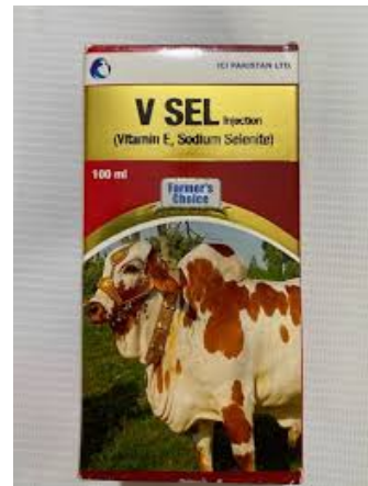
Slika 3: Izgled pakiranja natrijev selenita – dodatka selena u hranidbi goveda