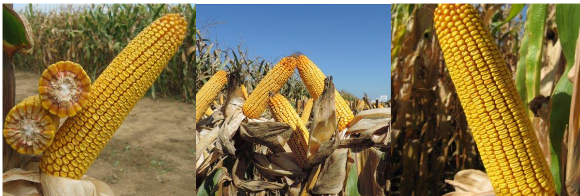
Slika 10.: Plod hibrida OS 378