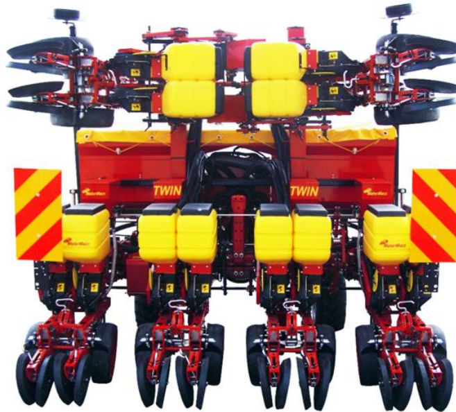
Slika 3. Matermacc Twin Row 2 sijačica

Tvrtka MaterMacc osnovana je početkom 80-ih prošlog stoljeća, a od siječnja 2015. godine postala je dio Foton LovoI International Heavy Industry Group. Proizvodni pogoni navedene tvrtke nalaze se u San Vito al Tagliamento , u pokrajini Pordenone u blizini Venecije. Tvrtka MaterMacc specijalizirana je za razvoj i proizvodnju pneumatskih sijačica za sjetvu tradicionalnih ratarskih kultura (Slika 3).