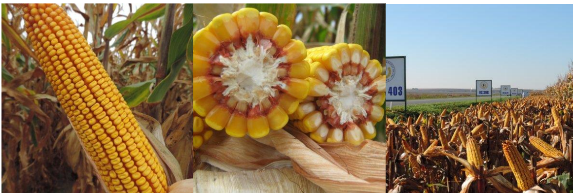
Slika 8. Plod hibrida kukuruza OSSK 403