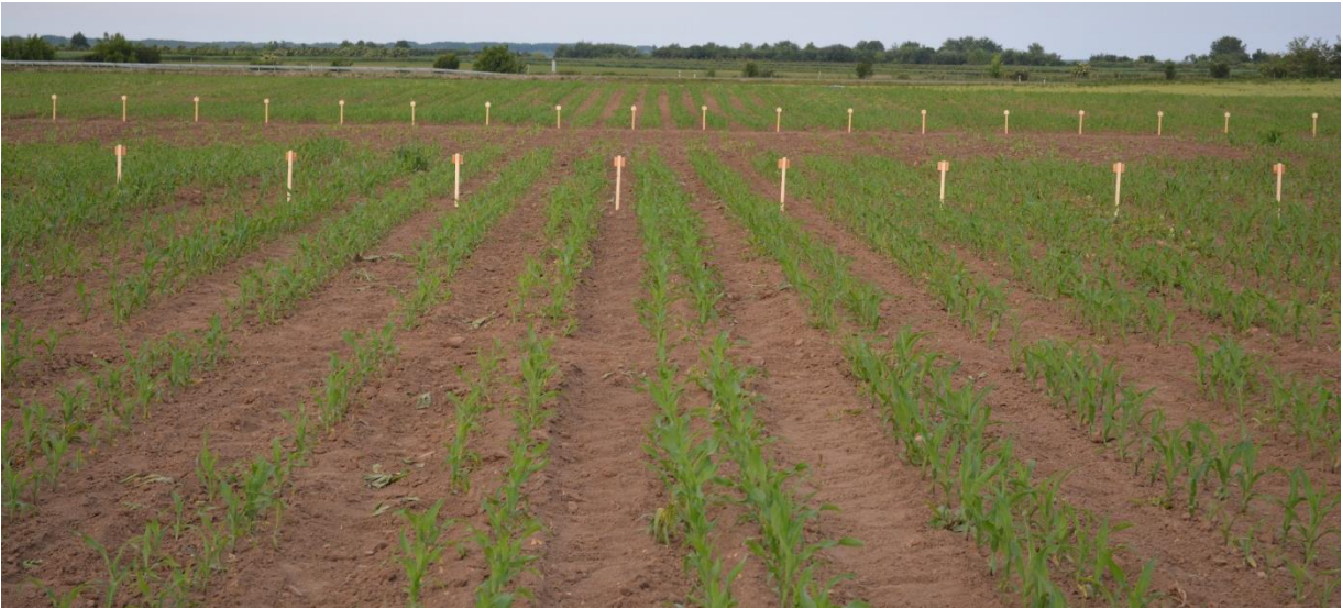
Slika 11. Tlo na pokušalištu Fakulteta agrobiotehničkih znanosti Osijek

Na pokušalištu Klisa (Slika 11.) prevladava eutrično smeđe tlo koje pripada odjelu automorfnih tala, klasi kambičnih tala, sa sklopom profila P-C zbog antropogenizacije sklopa A-(B)v-C obradom tla. Tlo prema teksturi pripada u praškaste ilovače te je malo porozno s osrednjim kapacitetom tla za vodu u oraničnome i podoraničnom horizontu. Reakcija tla je alkalna u svim horizontima, s dosta humoznim oraničnim slojem s umjerenom opskrbljenošću fosforom 15,58 mg/100 g te s umjerenom opskrbljenošću kalijem (Tablica 1.). Neke pedomorfološke značajke korištenog tla prikazane su u Tablici 1.