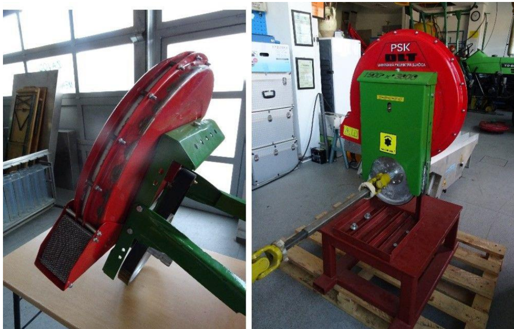
Slika 2. Radijalni ventilator sijačice PSK4

Pneumatska sijačica sastoji se od nekoliko elemenata koji su povezani u jednu cjelinu, a to su: trotočje i noseća greda, radijalni ventilator (Slika 2.), sjetveni uređaj, mjenjačka kutija i prijenosnici, markeri, zagrtaiči sjemena i nagazni kotači te dodatna oprema.