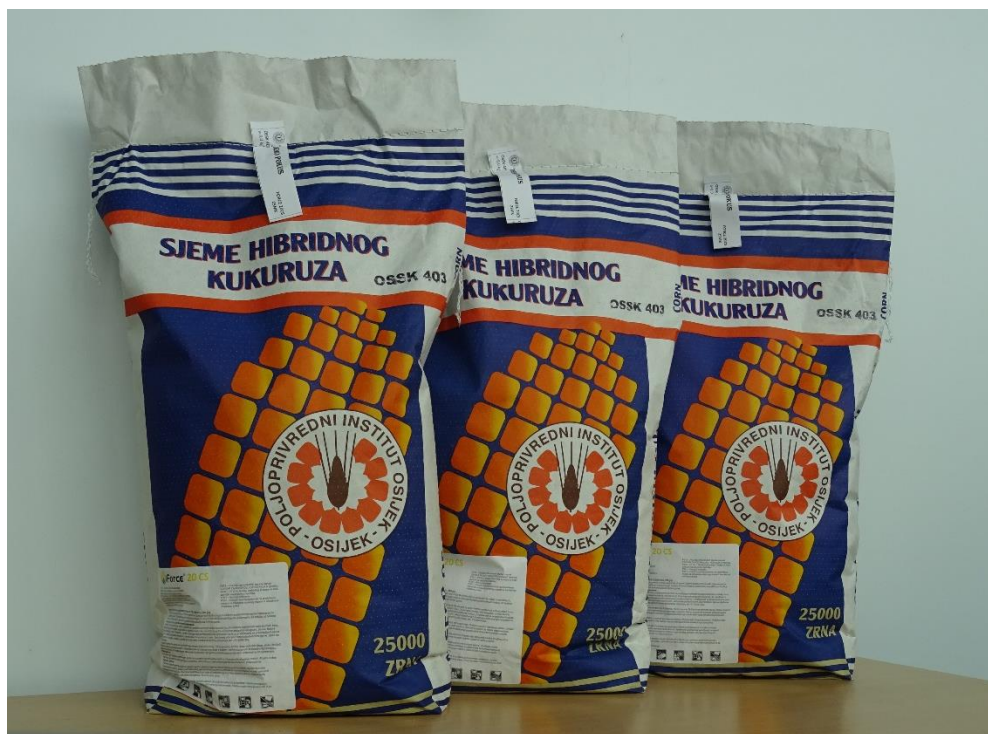
Slika 7. Sjeme hibrida kukuruza OSSK 403