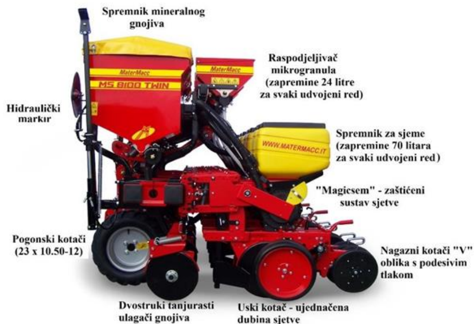
Slika 4. Glavni sustavi sijačice Maternacc Twin Row 2