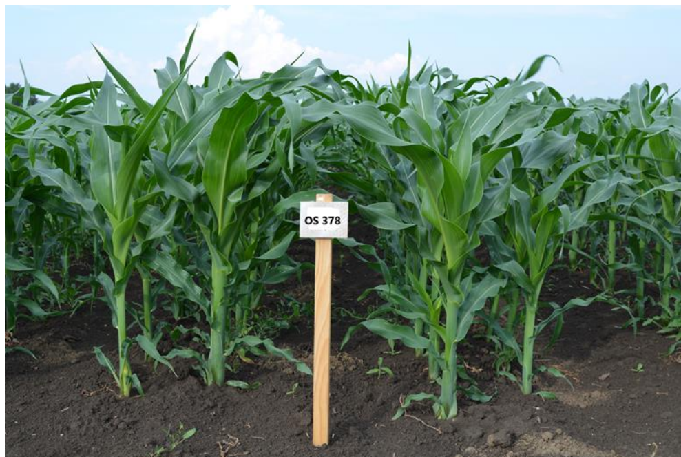
Slika 9.: Hibrid OS 378