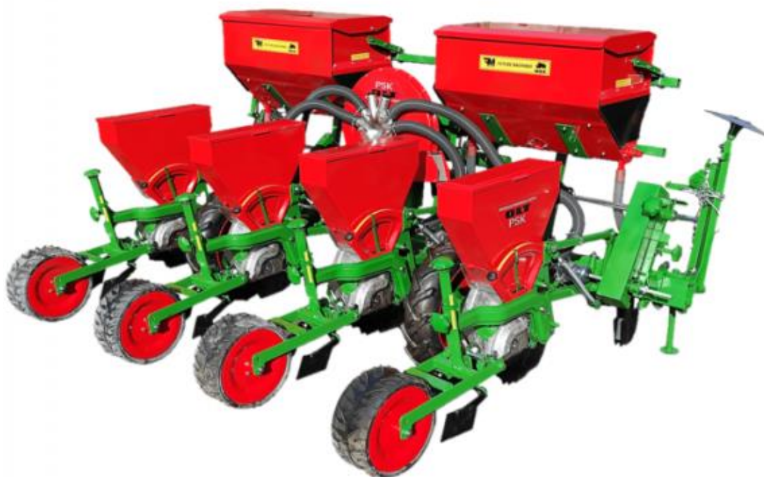
Slika 1. Pneumatska sijačica PSK-OLT 4

Sijačica tipa "PSK" je pneumatska sijačica koja se može univerzalno koristiti za sve širokoredne usjeve (Slika 1). U osnovnoj izvedbi služi za sjetvu kukuruza, a dodatnom opremom i zamjenom sijačice može se koristiti za različite primjene u sjetvi šećerne repe, soje, suncokreta i povrtnih kultura.