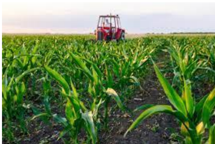
Slika 6. Međuredna kultivacija kukuruza (izvor: Agroklub.hr)

Međuredna kultivacija (Slika 6.) je agrotehnička mjera kojom razbijamo pokoricu tla i uništavamo novo iznikle korove. Ova agrotehnička mjera ima izuzetnu važnost, posebno u sušnim godinama, jer sprječava gubitak vlage iz tla te poboljšava uvjete za zrak i mikroorganizme u tlu. Također, međurednom kultivacijom se unose mineralna gnojiva u tlo, što igra ključnu ulogu u poticanju rasta i razvoja kukuruza (Lazić, 1990.).