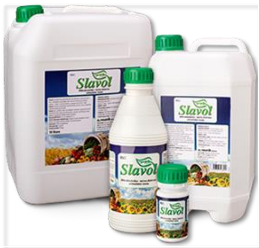
Slika 11. Slavol

Druga se obavlja tijekom fenološke faze vlatanja s KAN-om u iznosu od 185 kg/ha. Treća, ujedno i završna prihrana 2020. i 2021. godine obavljena je folijarnim putem s tekućim mikrobiološkim gnojivom Slavol (Slika 11.) u dozi od 7 l/ha. 2022. godine je izmijenjena završna prihrana odnosno treća koja se ove godine nije izvodila sa Slavolom, nego sa mineralnim gnojivom Mortonijc Plus, namijenjenom za folijarnu prihranu. Mortonijc Plus (Slika 12.) primjenjuje se u fenološkoj fazi klasanja u kombinaciji sa sredstvima za zaštitu bilja u dozi od 3 kg/ha.