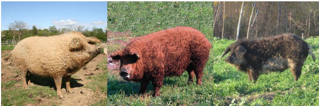
Slika 1. Bijeli, crveni i lasasti soj mangulice

Nastankom bijele mangulice i naglim porastom njenog broja došlo je do širenja ove pasmine u sve dijelove tadašnje Ugarske, pa tako i u Srijem i Banat. U Srijemu je, na gospodarstvu u blizini mjesta Buđanovci došlo do križanja bijele mangulice s tadašnjom „sremskom svinjom” („crna rudasta sriemska svinja”) koja je bila crne boje, a pretpostavlja se da je nastala križanjem šumadinke i crnih talijanskih svinja. Rezultat takvog križanja je svinja sivo crne čekinje s prljavo žutom linijom od donjeg dijela gubice, preko vrata, trbuha pa sve do repa, čiji je vrh crn. Ta svinja nazvana je lasastom mangulicom. Prema nekim izvorima, naziv je dobila po lasici ili po ptici lastavici, na čiju boju perja podsjeća, zbog kontrasta svjetle trbušne i tamne dlake. Prema drugim izvorima, za njeno ime zaslužni su žitelji Buđanovaca koje su tada nazivali „lasanima”. U to vrijeme, ovu svinju još se nazivalo i Buđanovačka rasa. Ona je posebno značajna za hrvatsko svinjogojstvo jer je sudjelovala u nastajanju crne slavonske svinje – fajferice. U istočnom Banatu, današnja Rumunjska, nastao je i treći soj mangulice - crvena mangulica.