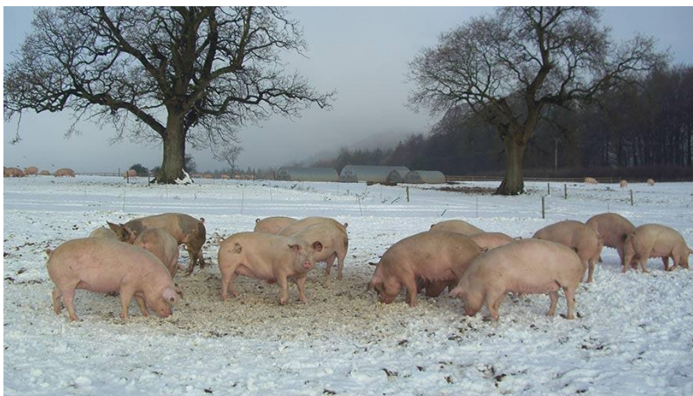
Slika 10. Držanje svinja u uvjetima niskih temperatura okoliša

Temperatura okoliša može utjecati na masno tkivo svinja. U hladnim okruženjima svinje mogu iskusiti povećanje taloženja potkožnog masnog tkiva kao prirodni odgovor na osiguravanje izolacije i održavanje tjelesne temperature. Dodatna mast djeluje kao izolacijski sloj, pomažući svinjama da očuvaju toplinu i smanje gubitak topline u okolinu. Niske temperature mogu potaknuti nakupljanje potkožnog masnog tkiva kako bi se poboljšala toplinska regulacija i zaštitila svinja od hladnog stresa (Uremović i Uremović, 1997.).