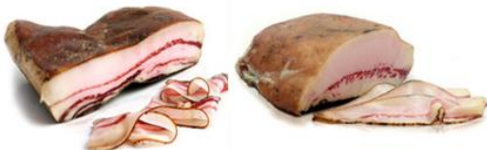
Slika 2. Slanina od mangulice

Istraživanje sastava masnih kiselina i udio kolesterola u svinjskoj masti mangulica i križanaca s mangulicom pokazuje da je udio nezasićenih masnih kiselina svinjske masti iznosio je preko 60 % kod mangulice i gotovo 60 % kod križanaca mangulice. Većina tih masnih kiselina bila je oleinska (43,6 – 44,8 %) i linolna kiselina (10,6 – 11,5 %). Pri tome, koncentracija kolesterola nije se značajno razlikovala između mangulica, njenih križanaca i mesnatih pasmina svinja, no kod mangulice i njenih križanaca utvrđen je veći udio tzv. „dobrog” kolesterola. Navedeno je da se 68,7 % udjela unutarmišićne masti u m. longissimus dorsi sastojalo od nezasićenih masnih kiselina, što je najmanje 6 % više nego kod njemačkog landrasa i njemačkog Sattelschweina. Sve navedeno dovelo je do toga da danas, osim nutricionista, čak i liječnici preporučuju konzumiranje masti od mangulice u preventivne i kurativne svrhe (Parunović i sur., 2015.).