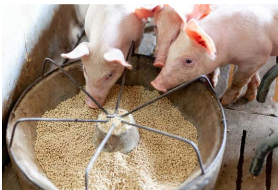
Slika 5. Hranidba svinja

Metabolizirajuća energija (ME) predstavlja energiju koja je dostupna svinji nakon što se uzme u obzir energija izgubljena u izmetu, urinu i plinovima nastalim tijekom probave. Obično se izražava u kilokalorijama (kcal) po kilogramu (kg) ili megadžulima (MJ) po kilogramu krmiva. Udio ME u hrani za svinje utvrđuje se laboratorijskom analizom ili procjenjuje na temelju sastava sastojaka krme (Switonski i sur., 2010.).