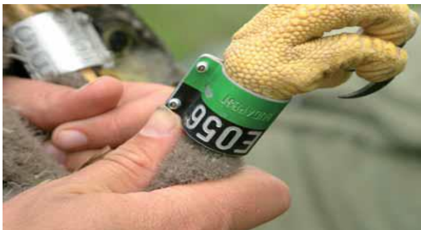
Slika 15. Prstenovani orao štekavac s mađarskom oznakom korištenom u razdoblju 2005.–2007.godine