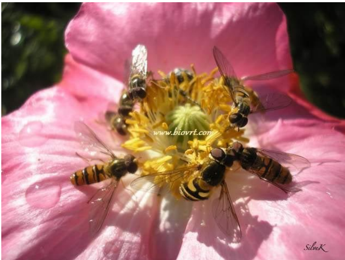
Slika 13. Episyrphus balteatus ,

Muhe cvjetare sreću se najčešće na cvijeću i cvijetnim livadama, gdje se hrane nektarom, cvijetnim prahom i mednom rosom. Imaju izduženo i zdepasto tijelo 3-25 mm, često prekrivene dlakama, uočljivih boja. Iako izgledom slične osama, letom oponašaju pčele, ose i druge vrste kukaca da bi se zaštitile od grabežljivaca. Let im je osobit. Pokretima krila lebde iznad cvijeta, poput leta u jednom mjestu. Nakon sparivanja ženka odlaže jaja pojedinačno na biljke, uvijek pored kolonije biljnih uši. Jaja su duguljasta, bijela, dužine 0,5-1 mm. Ličinke su grabežljivci bez nogu. Hrane se biljnim ušima koje nalaze na voćnim vrstama i cvijeću. Ličinke prvog stupnja su prozirne, a ličinke drugog i trećeg stupnja mijenjaju boju ( zelena, siva, crna) ovisno o vrsti biljnih uši kojom se hrane. Ovisno o vrsti, jedna ličinka muhe cvjetare isiše dnevno 40-150 biljnih uši, a tijekom svog razvoja 500. Među brojnim vrstama u nas su poznate : Episyrphus balteatus (slika 13.), Eupeodes (slika 15.) vrste ( susrećemo ih na cvjetovima voća, povrća i cvijeća) i Syrphus ribesii (slika 14.).