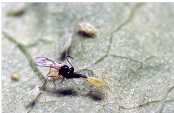
Slika 26. Osica Aphidius ervi napada lisnu uš