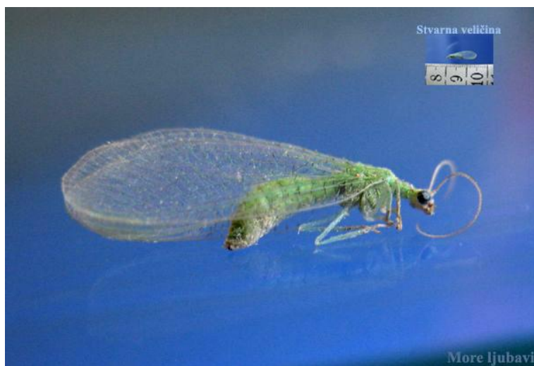
Slika 19. zlatooka ( Crysoperla carnea )

Prava je ljepotica među kukcima jer ima vitko, zeleno tijelo, dva para mrežastih krila, velike, zlatne, sjajne oči i duga ticala (slika 19,20.). Odrasle jedinke hrane se peludom, nektarom i mednom rosom. Ženka zlatooke polaže do 350 jaja, koja na dugim nosačima uvijek postavi na naličje lista, najčešće u blizini kolonije biljnih uši. Iz jaja se razvijaju ličinke, osobito korisne u vrtu jer se hrane biljnim ušima, jajima leptira i grinja, te štitastim ušima i resičarima. Ličinka se intenzivno hrani i jača tijekom dva tjedna svog razvoja te pojede između 200 do 500 biljnih uši, 500 jaja leptira ili 12 000 jaja grinja. Obitavaju u živicama, odakle polijeću u povrtanjak ili voćnjak. Privlači ih crvena boja pa tako treba obojati kućice koje ćemo postaviti.