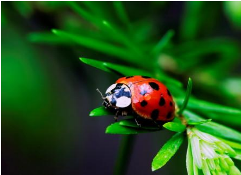
Slika 10. Božja ovčica ( Coccinellidae ),

Postoji još Stethorus punctillum (slika 12.) koja je crne boje, 1-1,5 mm i predator je crvenog pauka. Nalazimo je u intenzivnim voćnjacima, a u ekstenzivnim se gotovo i ne pojavljuje. Hrani se grinjama, preferira koprivinu grinju.