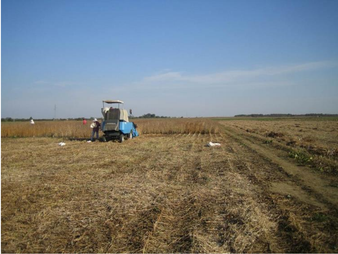
Slika 7. Žetva pokusnih parcela