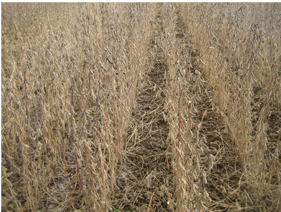
Slika 4. Nadzemni dio sorte Tena - zrioba

tretmana s bakteriziranim sjemenom sorata Tena i Sara (40,4 g). Sorta Julijana kod kontrolnog tretmana je u 2014. godini imala apsolutno najnižu masu nadzemnog dijela biljke (32,8 g). U istoj godini najveća masa nadzemnog dijela biljke zabilježena je kod tretmana s bakteriziranim sjemenom sorte Tena (48,9 g) i Sara (48,8 g). Gagro i Herceg (2005.) navode kako se sjetvom soje u kasnijim rokovima smanjuje masa nadzemnog dijela biljke.