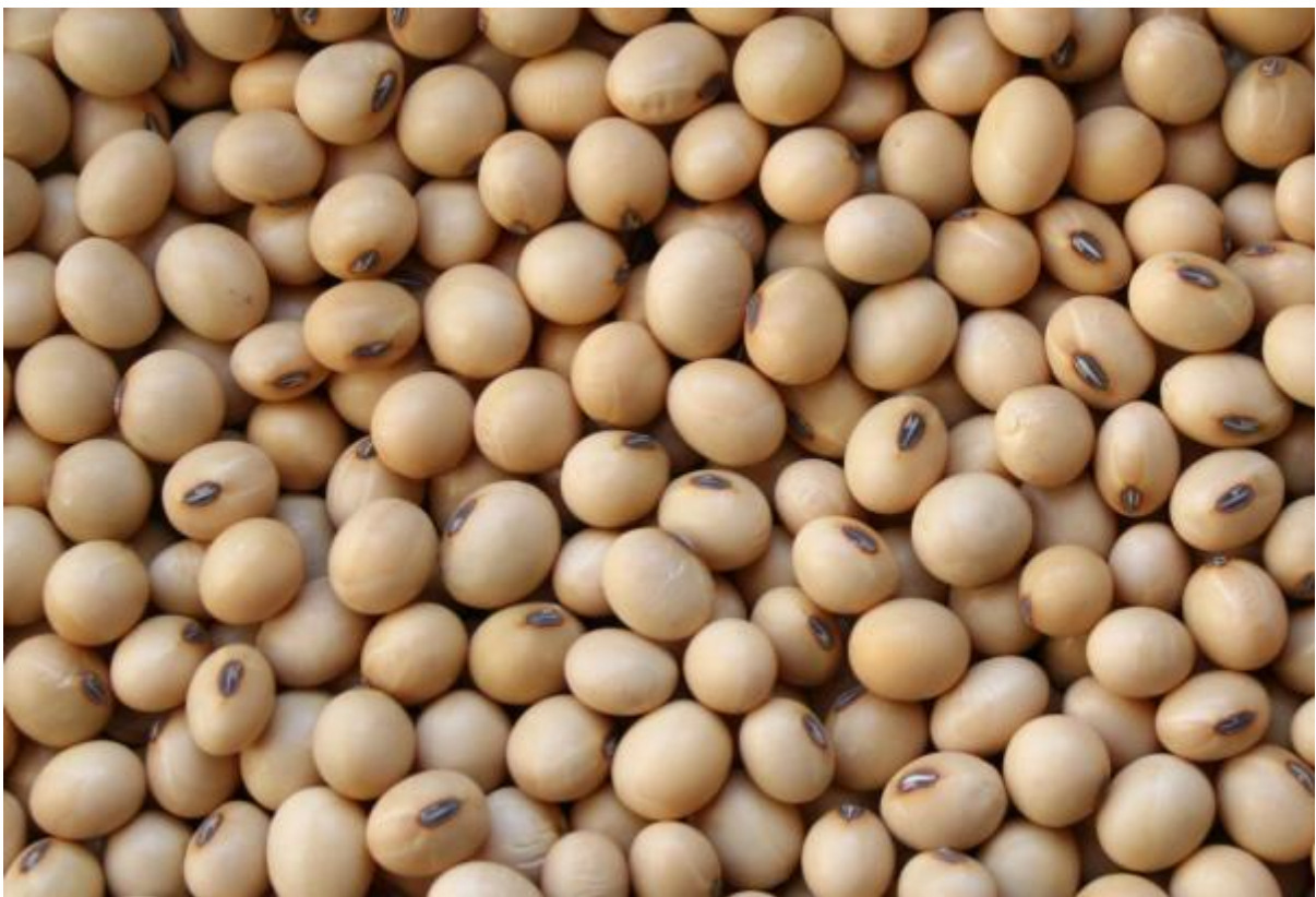
Slika 1. Zrno soje

Razlike između genotipova soje u potencijalu nitrofikacije potvrdili su i Sudarić i sur. (2008.) koji u svom istraživanju ukazuju i visoko značajno pozitivan učinak bakterizacije na urod zrna i na kakvoću zrna soje (Sudarić i sur. 2010.)