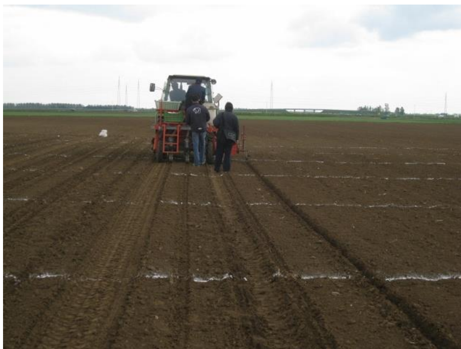
Slika 2. Sjetva soje na pokusnim površinama Poljoprivrednog instituta Osijek

Na pokusnom polju Poljoprivrednog instituta Osijek (eutrični kambisol; pH 6,5; humus 2,13%; 22,6 mg P 2 O 5 /100g tla; 30,4 mg K 2 O/100g tla) tijekom 2013. i 2014. godine postavljeni su pokusi s dvije varijante (kontrola i bakterizirano sjeme) u četiri ponavljanja. Sjetva je obavljena ručno u optimalnom roku za soju u svakoj godini ispitivanja (Slika 2.). Pokusna parcela iznosila je 12,5 m 2 (5 redova x 5m dužine x 0,5 m međuredni razmak) uz planirani broj od 650000 biljaka/ha za rane i 580000 biljaka/ha za srednje rane sorte. Prije sjetve, sjeme kod tretmana s bakterizacijom je tretirano (inokulirano) mikrobiološkim preparatom koji sadrži bakterije soja Bradyrhizobium japonicum za simbiozno vezivanje molekularnog dušika iz zraka. Pokusi su tretirani herbicidnom kombinacijom Dual Gold 960EC (alfa-metolaklor) + Sencor WP 70 (metribuzin) (11+0,5 kg) poslije sjetve, a prije nicanja. Uz dvije međuredne kultivacije, pokusi su bili bez korova tijekom vegetacije. Pokusne parcele su požete kombajnom. Urod zrna određen je vaganjem zrna sa svake pokusne parcele uz mjerenje vlage zrna. Urod zrna po parceli preračunat je na vlagu 13% i u tone po hektaru (t/ha). U žetvi je izmjerena visina i težina biljaka, te broj etaža i broj mahuna.