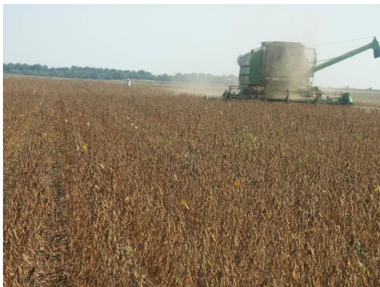
Slika 6. Žetva soje