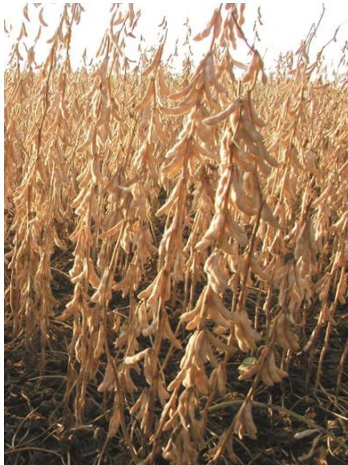
Slika 3. Sorta Ika – stabljika pred žetvu

Razlike u visini biljaka po godinama istraživanja nužno je promatrati povezano s vremenskim prilikama. Relativno dugo sušno razdoblje tijekom srpnja i kolovoza 2013. godine svakako je značajno utjecala na normalan rast biljaka, što je za posljedicu imalo nešto nižu visinu biljaka. Gagro i Herceg (2005.) navode kako rok sjetve značajno utječe na visinu stabljike soje, te se s pomicanjem roka sjetve djeluje na smanjenje visine stabljike.