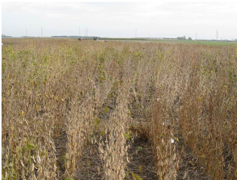
Slika 5. Izgled soje pred žetvu

t/ha). U ovoj godini apsolutno najveći urod zrna izmjeren je kod tretmana s bakterizacijom sorte Ika (4,6 t/ha), a kod sorte Tena u istoj godini izmjerena veličina uroda zrna bila je tek neznatno niža (4,5 t/ha). Sorta Ika je u obje godine istraživanja najbolje reagirala na bakterizaciju te je u 2013. godini urod zrna u odnosu na kontrolu povećan za 14,7%, a u 2014. godini za 17,9 %. Koliko uvjeti povećane vlažnosti mogu biti važni za povećanje uroda zrna navode i Candogan i sur. (2013.) za agroekološke uvjete zapadne Turske.