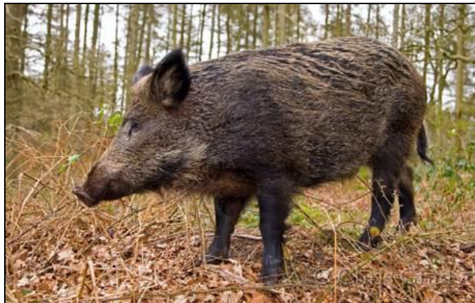
Slika 5: Divlja svinja