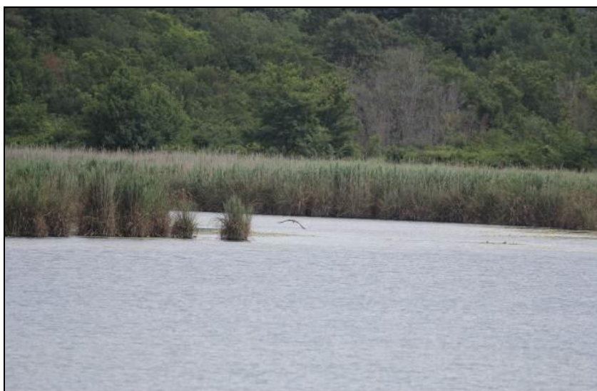
Slika 12: Jezero kraj Njivica - lovište VIII/101 Krk