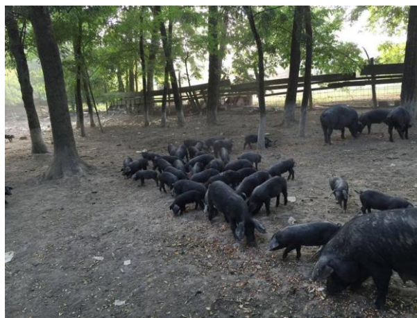
Slika 12. Držanje krmača s podmlatkom na otvorenom

Crna slavonska svinja u Hrvatskoj se uzgaja na ekstenzivni i poluekstenzivni način. Ovakav vid hranidbe omogućuje potpuno iskorištenje genetskog potencijala crne slavonske svinje u pogledu njezine plodnosti i mesnatosti (Karoly, 2010.). U zadnjih desetak godina u Republici Hrvatskoj bilježi se rast ekstenzivnog uzgoja crne slavonske svinje ili fajferice, koja je po svojim morfološkim i fiziološkim svojstvima prilagođena ovakvom načinu uzgoja i klimatskim uvjetima koji prevladavaju u Slavoniji i Baranji (Margeta i sur., 2015.). Kroz povijest crna slavonska svinja je držana na tradicionalniji način koji je podrazumijevao napasivanje na pašnjacima i žirovanje u šumama Slavanskog hrasta. Danas se povećava broj fajferica uzgajanih na ovakav način što omogućuje proizvodnju naših kvalitetnih tradicionalnih proizvoda i bolju poziciju na tržištu. Uzgoj crnih slavonskih svinja u Hrvatskoj podrazumijeva držanje svinja u šumama i napasivanje na kvalitetnoj ispaši, te je crna slavonska svinja prilagođena za iskorištavanje paše i voluminozne krme. U Hrvatskoj se žirovala sve do 60-ih godina prošlog stoljeća. Žirovanje svinja (iako je danas u Hrvatskoj zabranjeno držanje svinja u šumama) se provodi od prosinca do veljače te se svinje većinom hrane žirom hrasta lužnjaka i kitnjaka. Upravo donošenje zakona o šumama u kojima je silvopastoralni način držanja svinja zabranjen, imao je veliki utjecaj da se ova tradicija žirovanja danas u potpunosti izgubila.