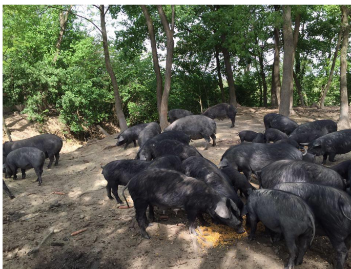
Slika 14. Prihrana prasadi s kukuruzom

Hranidba svinja na ekstenzivan način podrazumijeva hranidbu svinja na pašnjacima, u šumama te prihranjivanje, posebno u zimskom periodu, kukuruzom i ostalim žitaricama. Napasivanje svinja ima bolji utjecaj na svinje nego hranidba u zatvorenom prostoru jer vrlo brzo povećava obujam probavnih organa pa životinje mogu konzumirati veće količine hrane. To je posebno bitno za krmače, pogotovo u razdoblju laktacije. U tom slučaju manja je razgradnja tjelesnih rezervi potrebnih za sintezu mlijeka. Paša sadrži jako veliku ugljikohidratnu i vitaminsko – mineralnu komponentu ali zbog veće količine vlakana potrebna je velika masa koju životinja mora konzumirati. Sama ispaša može zadovoljiti potrebe gravidnih krmača, ali ne i onih u laktaciji. Kod njih je potrebna dodatna hrana, a tu koristimo voluminozu (kukuruzne silaže, stočne repe, krumpir, bundevu, mrkvu) te koncentrat (Pejaković 2002.).