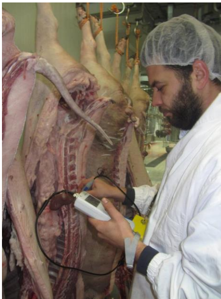
Slika 20. Određivanje pH vrijednosti u MLD-u

Boja mesa određivana je pomoću Minolta kolorimetra (CR 300, Minolta Camera Co. Ltd., Osaka Japan). Minolta – 300 mjeri boju na odsječku najdužeg leđnog mišića 24 sata post mortem . Boja mesa je određena s tri vrijednosti, L^* , a^* i b^* , L^* koje označavaju bljedoću, a^* stupanj crvenila mesa i b^* mjeri stupanj žute boje. Kao standard pri mjerenju je korištena bijela pločica ( L^*=93,30 ; a^*=0,32 ; b^*=0,33 ).