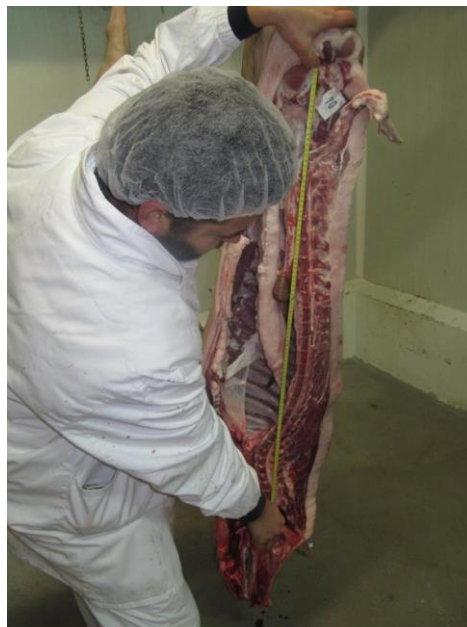
Slika 17. Mjerenje dužine polovice

Na liniji klanja određeni su masa polovica, dužina polovica, dužina i opseg buta i debljina slanine i mišića. Dužina polovice „a“ mjerena je od prvog reba do os pubis . Mjera polovice „b“ mjerena je od os pubis do atlasa .