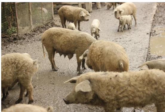
Slika 10. Turopoljska svinja

Uz crnu slavonsku svinju, turopoljska svinja također spada u autohtonu pasminu koja je nastala na području Turopolja. Pripada primitivnim pasminama svinja, te u masnu pasminu. Tijelo je duboko i kratko, obraslo kovrčavom dlakom, žućkasto prljave boje s crnim mrljama (Kralik 2011.) te je koža nepigmentirana (Kralik, 2007.). Plodnost je srednja te krmača prasi 6 do 7 prasadi u leglu. Prasad s 8 tjedana dostižu 12 kg, a sa 6 mjeseci 40 kg. Tovljenici postižu 150 do 160 kg sa 16 – 18 mjeseci s visokim randmanom od 85 % (Uremović Z., Uremović M., 2002.). Vrlo otporna pasmina i pogodna za ekstenzivan uzgoj.