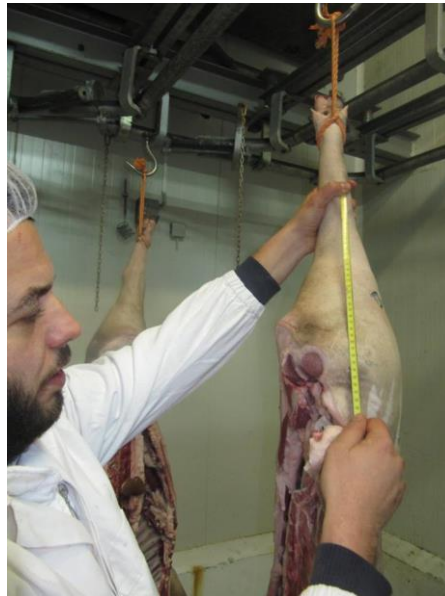
Slika 18. Mjerenje dužine buta

Metodom dvije točke mjerena je debljina leđne slanine na mjestu gdje m. gluteus medius najdublje prodire u slaninu (S). Debljina mišića određena je na mjestu gdje je najkraća udaljenost između kranijalnog završetka m. gluteus medius-a i dorzalnog spinalnog kanala.