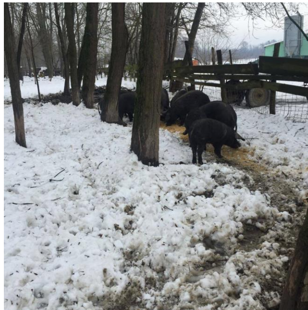
Slika 15. Hranidba crnih slavonskih svinja tijekom zimskog razdoblja

pasmine te se tako kod nas posebno ističe crna slavonska svinja, koja najveći potencijal za uzgoj ima u hrastovim šumama ali i u šumama bukve i pitomog kestena. Zbog velikih zahtjeva svinja u graviditetu i laktaciji, te preko zimskog perioda, uz prirodnu hranu potrebno je dodavati žitarice te drugu voluminozu. Uz to, veoma je bitno svinje izvoditi na pašnjake i strništa (Margeta i sur., 2013.). Ovaj sustav također ima i nedostatke kao što su uništavanje mladih stabala, križanje s divljim svinjama, prekomjerno povećanje populacije te mogući prijenos zarazne bolesti.