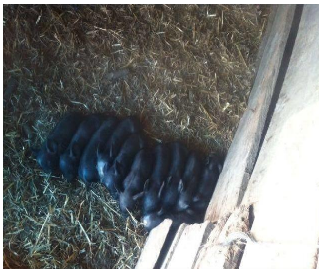
Slika 4. Prasad crne slavonske svinje

Udio i kakvoća mesa crna slavonske svinje ovisi o načinu hranidbe. Prema Uremović (2004.) postotak mesa tovljenika u tovu na paši, žiru uz dohranu kukuruza , kreće se oko 40 % u polovicama, te se unutarmišćna mast kreće od 4 do 8 %. Meso ima dobru sposobnost vezanja vode, što s ostalim svojstvima kakvoće je velika prednost za preradu u trajne proizvode. Meso crne slavonske svinje je zadovoljavajuće kakvoće, a boja