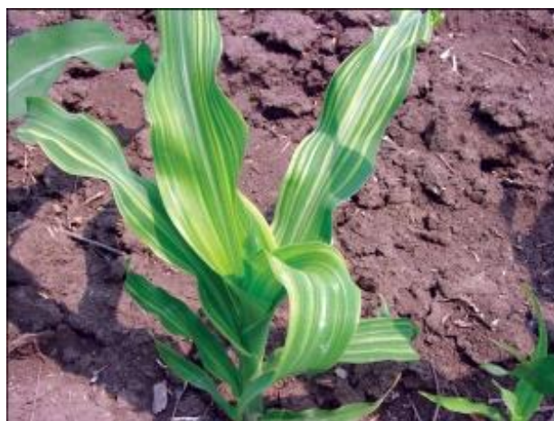
Slika 3. List kukuruza

Listovi se, prema mjestu gdje se zameću i nalaze te prema značaju, dijele na klicine listove, prave listove (listovi stabljike) i listove omotača klipa (listovi "komušine"). Klicini listovi imaju svoje začetke u klici sjemena. Ima ih 5-7, a potpuno se razviju u prvih 10-15 dana nakon nicanja kukuruza. Nakon što se formiraju pravi listovi, klicini listovi gube svoj značaj i veći dio ih propadne odnosno osuši se u prvom dijelu vegetacije. Pravi listovi (Slika 3.) nalaze se na stabljici. Na svakom koljencu nalazi se po jedan list, pa njihov broj varira kao i broj koljenaca. Najraniji hibridi u nas formiraju 13-18 listova, srednje kasni 18-21, a kasni 21-25. Listovi omotača klipa ili listovi "komušine" razvijaju se na koljencima skraćenog bočnog izdanka odnosno na dršci klipa. Listovi komušine imaju zaštitnu ulogu, jer štite klip i zrna na njemu od uzročnika bolesti, štetnika, ptica kao i nepovoljnih vanjskih čimbenika (Pospišil, 2010.).