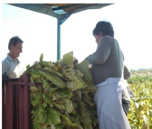
Slika 8. Berba duhana

Duhan se slaže u okvire odmah u polju, a zatim se puni okviri slažu u za to namijenjene specijalizirane prikolice (slike 9. i 10.).