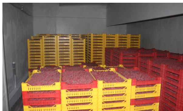
Slika 9. Zamrznuta malina u gajbama