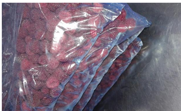
Slika 11. Zamrznuta malina