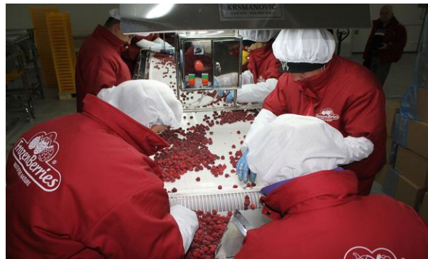
Slika 10. Pakiranje maline