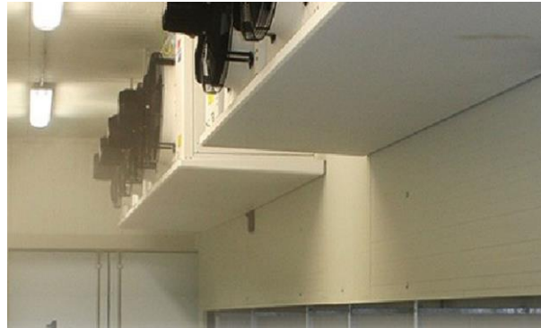
Slika 8. Tunel za zamrzvanje