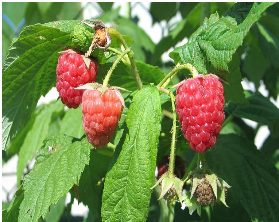
Slika 1. Malina sorte Willamette