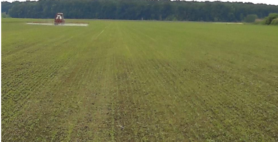
Slika 18. Soja