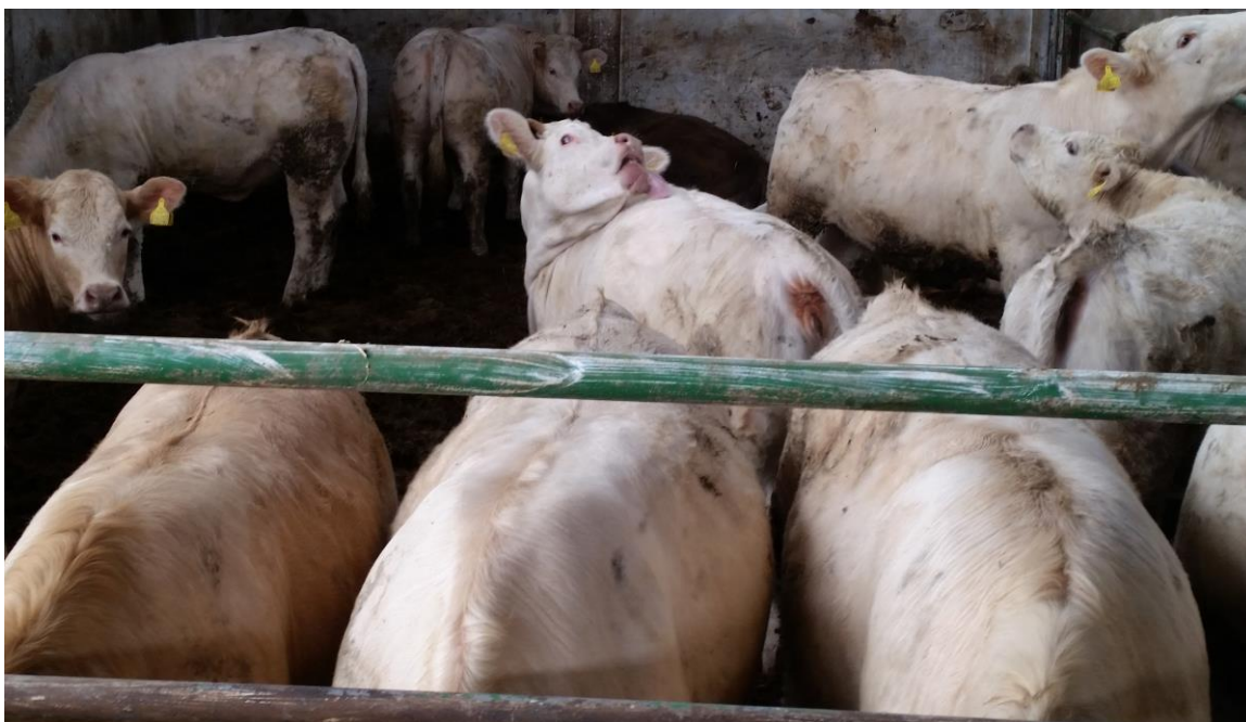
Slika 16. Junice charolais pasmine