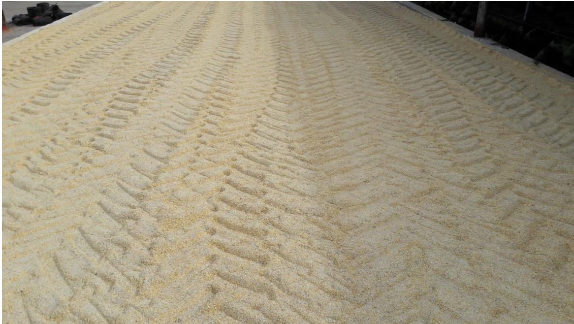
Slika 13. Visoko vlažni kukuruz