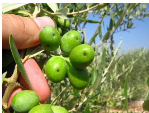
Slika 4. Šteta od svrdlaša na plodu masline (autor: Miroslav Filipović)

Za suzbijanje svrdlaša, u Republici Hrvatskoj dopušteno je sredstvo Rogor 40.