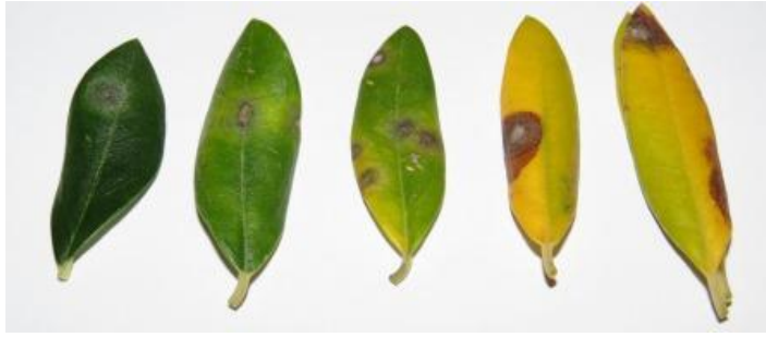
Slika 6. Paunovo oko na listu masline, (autor: Miroslav Filipović)

Iako je gljiva prisutna tijekom cijele godine u masliniku, ipak kroz zimsko razdoblje rijetko se može dijagnosticirati zaraza. Za rano otkrivanje prisutnosti paunovog oka, može se koristiti metoda „rane dijagnoze“ pomoću otopine NaOH ili KOH. Postupak obavljamo tako što mlađe listove potopimo u odabranu otopinu, pri sobnoj temperaturi na 20-23 minute. S pojavom crnih mrlja potvrđena je prisutnost patogena (Cvjetković i Vončina, 2012).