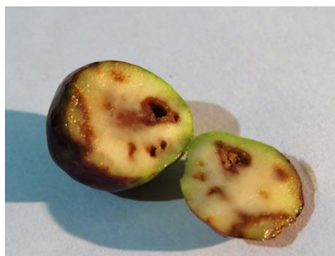
Slika 1. Oštećenja od maslinove muhe (autor: Miroslav Filipović)

Maslinina muha suzbija se najviše kemijskim putem. U Hrvatskoj su za ovu godinu dopuštena sredstva: Decis 2,5 EC, Rogor 40, Eco-Trap, Perfekthion i dr. Insekticidima se može tretirati čitav maslinik, no dodavanjem atraktanata insekticidima, može se tretirati samo jedan dio nasada. Način suzbijanja određuje se prema praćenju leta muhe. Za praćenje leta koriste se lovne posude (Tephri-trap lovke). U tim posudama nalazi se otopina olfaktornog