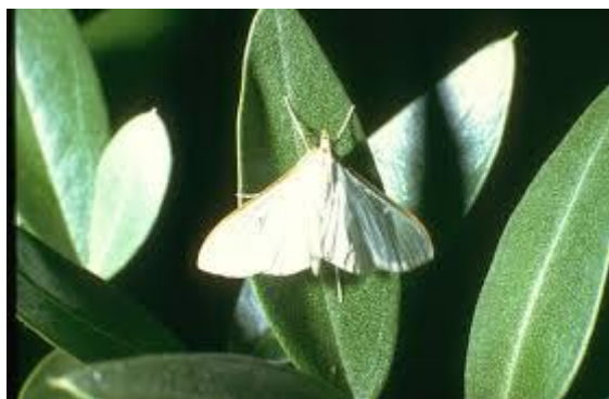
Slika 3. Leptir jasminovog moljca

Za kemijsko suzbijanje u Republici Hrvatskoj za ovu godinu dopušteno je sredstvo Cythrin max.