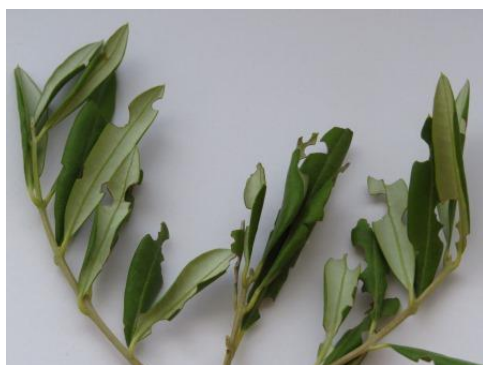
Slika 5. Grizotine od pipe na lišću masline (autor: Miroslav Filipović)

Maslinina pipa je crne boje, veličine 10-12mm. Štete radi na listovima u vidu grizotina na rubovima. Hrani se noću, a danju je skrivena u zemlji ili pod kamenom. Pri jačoj pojavi može smanjiti rast mladih izboja. Najčešće stradaju masline koje su u fazi obnove zbog starosti ili požara. Ličinke žive u tlu i hrane se korijenjem različitog bilja. Pipe se mogu mehanički odstraniti ili postaviti lovni pojasevi na deblo, budući da pipe ne lete (Maceljski, 2002.).