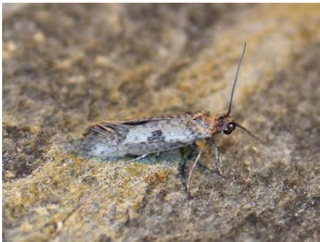
Slika 2. Leptir maslininog moljca

Maslinin moljac prezimljuje u obliku gusjenice, koja se tijekom ožujka kukulji. U periodu pojave cvjetnih resa, iz kukuljice izlijeće leptir (Slika 2.) čija ženka nakon kopulacije odlaze jaja na čašicu cvijeta, prije početka otvaranja cvijeta. Izlaskom iz jajeta, gusjenica se ubušuje u cvjetni pup, gdje se hrani. Gusjenica izlazi i počinje se hraniti izvan cvijeta prelazeći s jednog na drugi, ostavljajući zapredotine. Odrasla gusjenica kukulji se u cvjetnom zapretku ili u suhom lišću na tlu i u lipnju iz kukuljice izlijeće leptir, čije ženke nakon kopulacije odlože i do 120 jaja na čašicu ploda. Nakon tjedan dana izlaze gusjenice, koje se ubušuju u mlade plodove. Gusjenica prestaje s razvojem i napušta plod, koji krajem kolovoza i početkom rujna otpada. Nakon kukuljenja koje je najčešće u tlu, javlja se treća generacija maslinina moljca koja pravi štete na listu. Štete čini gusjenica, koja se po izlasku iz jaja izravno ubušuje u listu tu se hrani lisnim tkivom. Krajem svoga razvoja započinje uništavati list s donje strane, ne dodirujući gornju opnu, tj. epidermu lista. To je ujedno znak kako se u nasadu nalazi maslinin moljac. Gusjenica ove posljednje generacije kukulji se između listova, koje zapreda ili u pukotinama grana i grančica. Suzbijanje se provodi u razdoblju od polaganja jaja pa sve do cvatnje masline (Barbarić i sur., 2014.). Za ovu godinu u Republici Hrvatskoj dopuštena su ova sredstva: Perfekthion, Rogor 40, Baturad WP i drugi.