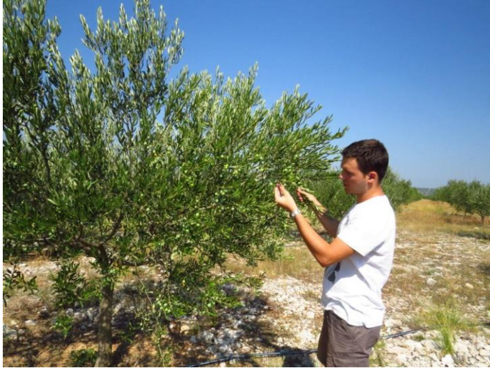
Slika 9. Vizualni pregled, (autor: Miroslav Filipović)

Promatrani maslinici nalaze se na brdovitom području, okruženi šumom i šikarom što doprinosi pojavi štetnika, osobito pipa. Ovisno o štetniku koji se kontrolira, vrši se pregled određenog biljnog organa.