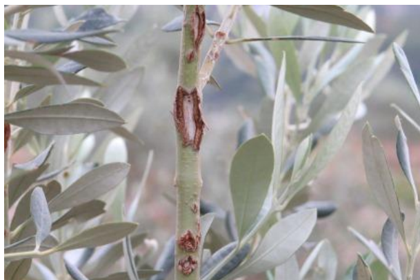
Slika 10. Oštećenja od malog cvrčka

pravi ubode na mladim grančicama, a u te ubode polaže jaja. Zbog dobre kondicije masline su uspjele zatvoriti oštećenja, a posebna zaštita nije bila potrebna.