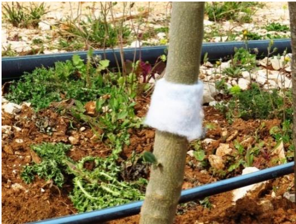
Slika 12. Lovni pojas za pipe (autor: Miroslav Filipović)

Maslinina pipa ( Otiorrhynchus cribricollis ) čest je gost u maslinicima. Štete radi odrasli kornjaš koji se penje uz stablo noću i izgriza vrhove listova. Veću štetu može pričiniti na mladim izbojima. Najučinkovitija borba protiv ovog štetnika je mehaničko odstranjivanje putem lovnih pojaseva. U svibnju 2016. godine postavljeni su lovni pojasevi (Slika 12.) od umjetne vune na stabla maslina. Obilaskom i pregledom postavljenih lovnih pojaseva uočena je manja brojnost odraslog oblika maslinine pipe.