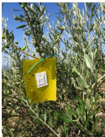
Slika 11. Žuta ploča sa feromonom

Pregledom žutih ljepljivih ploča kroz mjesec srpanj, uočen je manji broj jedinki maslininog moljca, jasminovog moljca, te maslinine muhe.