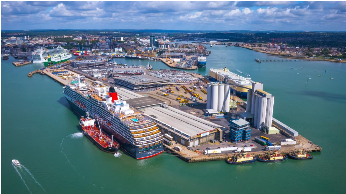
Slika 3. Terminal za kružna putovanja u Southamptonu