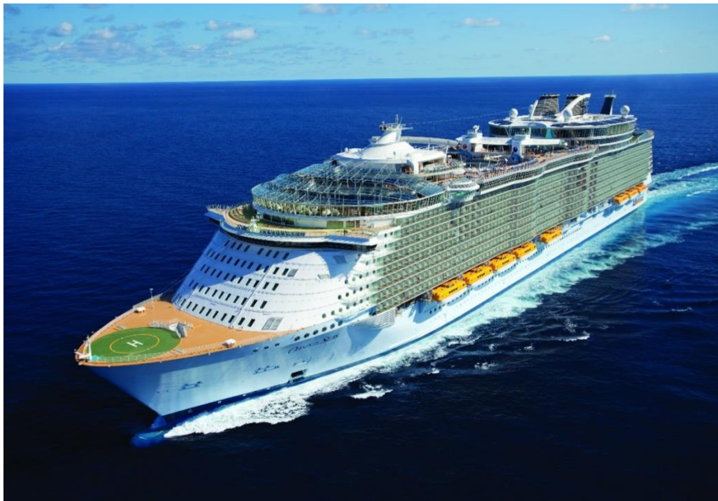
Slika 1. MS Oasis of the Seas [10]

Plovila se kategoriziraju na više načina, a mogu se podijeliti prema poslovnom modelu, veličini i načinu života putnika. Također, ovisno o dobi putnika kao i njihovim interesima i financijskoj slobodi, brodovi mogu biti namijenjeni za avanture, ugođaj, obrazovanje, kulturu, zabavu, sportske aktivnosti, wellness ili rekreaciju [5]. Slika 1. prikazuje brod za kružna putovanja MS Oasis of the Seas.