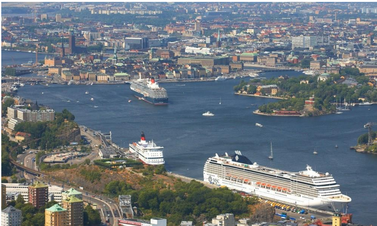
Slika 6: Terminal Nynashamn [7]

Između 2013. i 2016. godine obnovljena je cijela luka Vartahamnen s pet novih pristaništa s pametnim i ekološki prihvatljivim rješenjima te suvremenim putničkim terminalom.