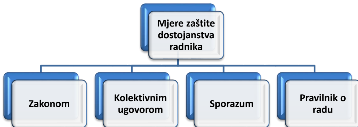
Slika 1. Postupci i mjere zaštite dostojanstva radnika [2]

Poslodavac ili osoba koja je ovlaštena za primitak i rješavanje pritužbi dužna je, u roku utvrđenom kolektivnim ugovorom, sporazumom sklopljenim između radničkog vijeća i poslodavca ili pravilnikom o radu, a najkasnije u roku od osam dana od dostave pritužbe, ispitati pritužbu i poduzeti sve potrebne mjere primjerene pojedinom slučaju radi sprječavanja nastavka uznemiravanja ili spolnog uznemiravanja ako utvrdi da ono postoji. [2]