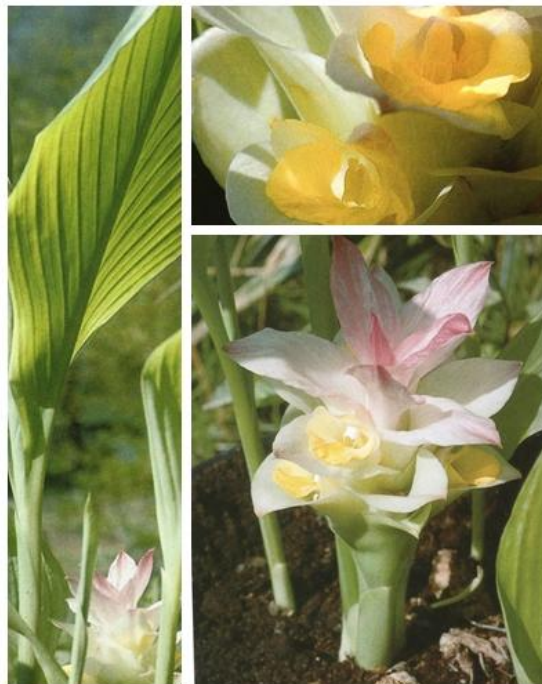
Slika 1. Curcuma longa L. (Schafner i sur., 1999)

Rod Curcuma L. (Zingiberaceae) sadrži više od 100 biljnih vrsta, među kojima je najpoznatija Curcuma longa L. To je višegodišnja biljka koja može narasti do 1,5 m visine iz gomoljastog podanka. Ima sjajne, velike, duguljaste ili široko lancetaste listove s dugom peteljkom i guste klasove blijedožutih cvjetova koji su ovijeni zaštitnim listom (slika 1). Glavni podanak je okruglast, 5 cm dug i 3 cm širok, s vodoravnim ožiljcima od listova. Ispod glavnog podanka razvija se korijenje koje mjestimično zadeblja i poprima cilindričan oblik (sekundarni podanci). Podanak je izvana žućkast, a u unutrašnjosti narančast do crvenkastosmeđ (slika 2) (online.lexi.com; Schafner i sur., 1999).