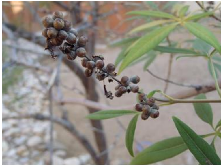
Slika 2. Konopljika u razdoblju stvaranja plodova