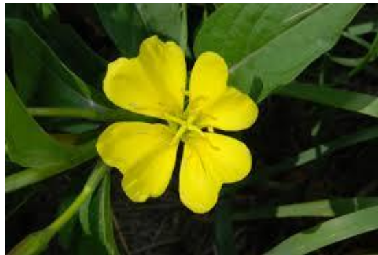
Slika 7. Oenothera biennis (L.)

SASTAV I AKTIVNE TVARI: Sjemenke sadrže 24% ulja koje je sastavljeno od linolne, \gamma -linoleinske, oleinske, palmitinske i stearinske kiseline. U sjemenkama se nalaze i bjelančevine s aminokiselinama koje sadrže sumpor- cistein, metionin i triptofan (Toplak Galle, 2001).