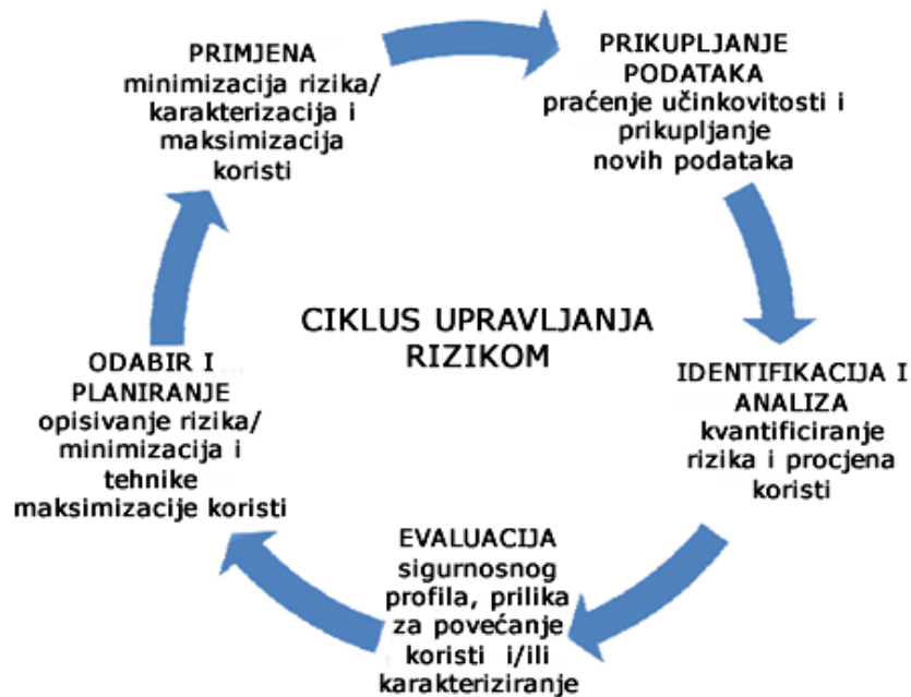
Slika 2. Ciklus upravljanja rizikom

Mjere minimizacije rizika predstavljaju javnozdravstvenu intervenciju koja ima namjeru prevenirati ili smanjiti vjerojatnost pojavljivanja nuspojave povezane s izloženošću lijeku ili smanjiti njenu ozbiljnost ukoliko se pojavi.