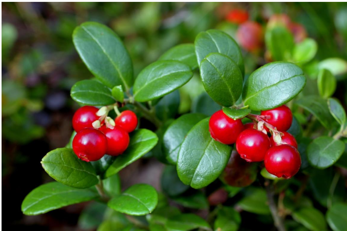
Slika 1. List i plod brusnice (preuzeto iz: www.gardeningknowhow.com )

Brusnica ( Vaccinium vitis-idaea ) je višegodišnji zimzeleni patuljasti grm. Spada u porodicu Ericaceae i u rod Vaccinium koji sadržava otprilike 150 različitih vrsta kao što su europske borovnice, sjevernoameričke borovnice, američke brusnice i dr. Kultivirane su sjevernoameričke borovnice, američke brusnice i brusnice iako se brusnice većinom skupljaju kao divlje (Padmanabhan i sur., 2016). Brusnice u prosjeku dosegnu visinu od 30 cm. Stabljika je uspravna, rijetko razgranata, drvenasta i dlakava. Listovi su naizmjenični, ovalni i obrnuto jajoliki, kratke peteljke, dugi 0.9 – 2.5 cm, kožasti i na vrhu su često zarežani. Lice lista je sjajno i tamno zeleno dok je naličje svijetlozelene boje i ima crne ili smeđe žlijezde koje izgledaju kao točkice. Rubovi su nazubljeni i pilasti, a nervatura se jasno očituje. Cvjetovi su sitni i zvonasti, bijele do ružičaste boje. Latice su pri dnu spojene, duge 5 – 8 mm i ima ih 4 u vjenčiću. Čaška se sastoji od 4 lapa. Jedan tučak je izbočen iz cvijeta, a prašnika ima 4 ili 8. Cvat je grozdasti. Cvatnja se događa u svibnju i lipnju, a sjeme dozrijeva od kolovoza do listopada. Plod je tamno crvene boje, okrugao, sjajan, sočan, jestiv i kiselog okusa ( www.luontoportti.com , www.landscapeplants.oregonstate.edu ).