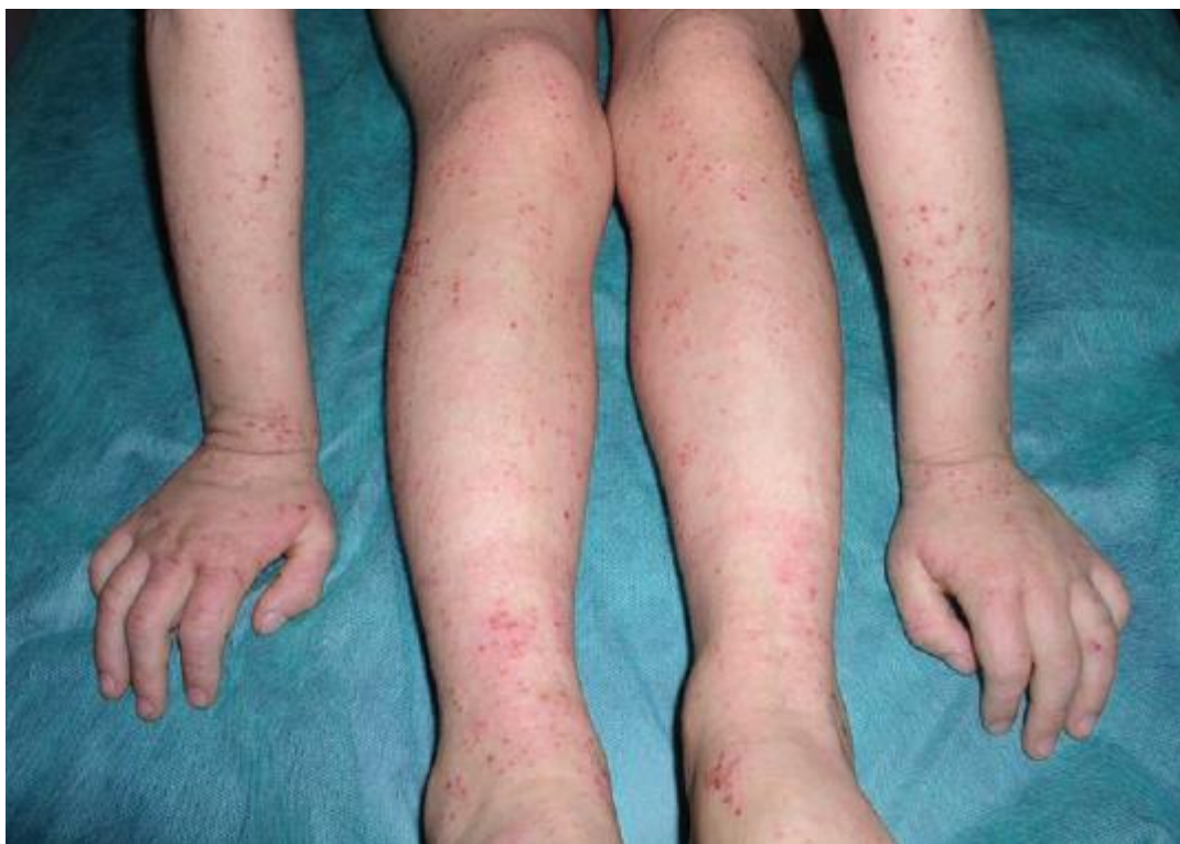
Slika 3. Generalizirane promjene uz ekzorijacije na ekstremitetima (Murat-Sušić, 2007)