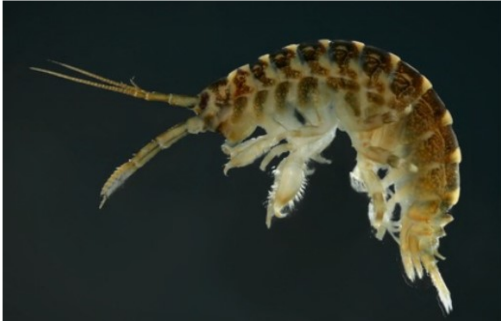
Slika 1: Dikerogammarus villosus (preuzeto iz Rewicz i sur., (2014))

do 30 mm u dužini tijela. S obzirom na godišnje doba razlikuje se stopa rasta, tako je mjesečni rast zimi između 1.3 i 2.9 mm, dok pri višim temperaturama u ljetnih mjeseci mogu narasti od 2 do 2.6 mm mjesečno. Životni vijek im je 2 do 3 godine, a budući da imaju nekoliko generacija godišnje dominiraju brojnošću (URL 1 , URL 2)).