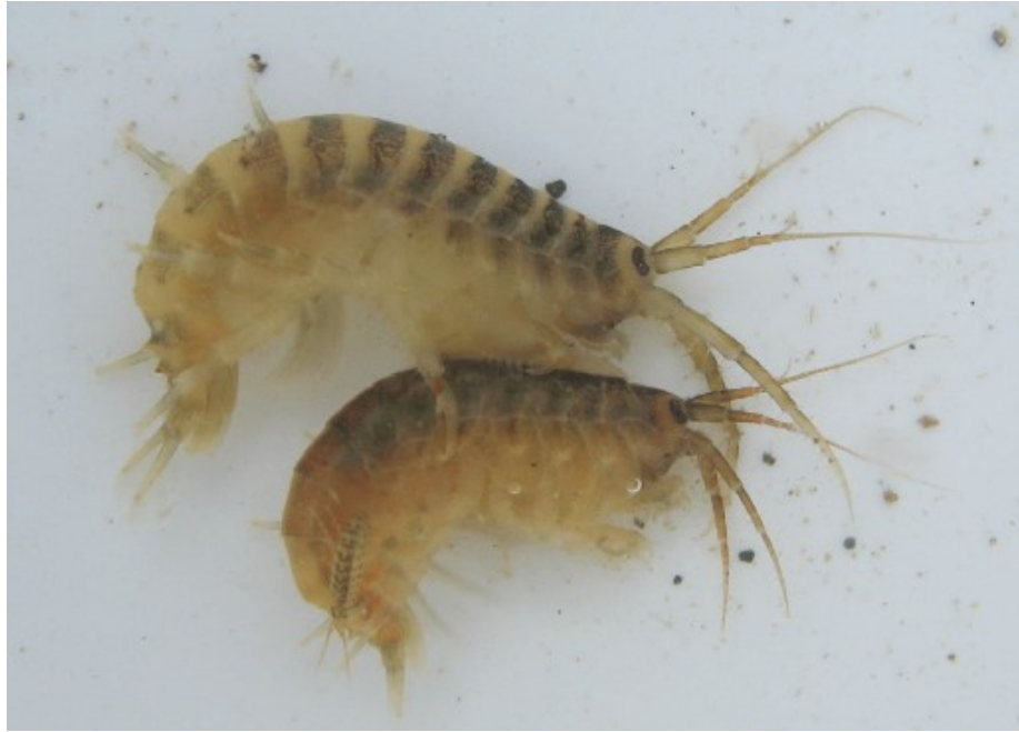
Slika 2: Dvije jedinke Dikerogammarus villosus u parenju

Ženka može istovremeno nositi 50 jaja u komori na trbušnoj strani tijela. Juvenilne jedinke kada izađu iz jajeta morfološki nalikuju odraslima, no mnogo su manjih dimenzija. Spolno su zreli kada dosegnu veličinu od 6 mm, što postižu nakon šestog presvlačenja ( URL 1).